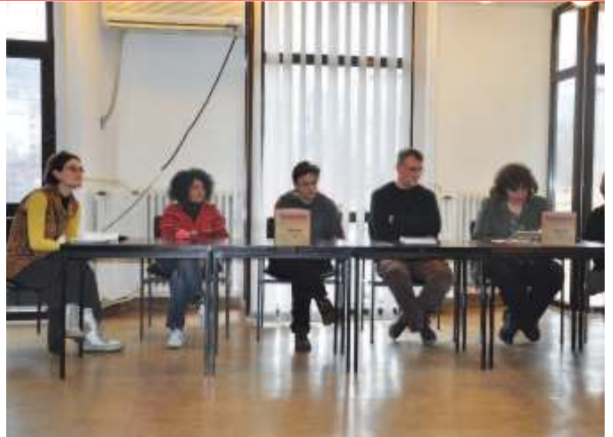
Са представљања "Бележнице"