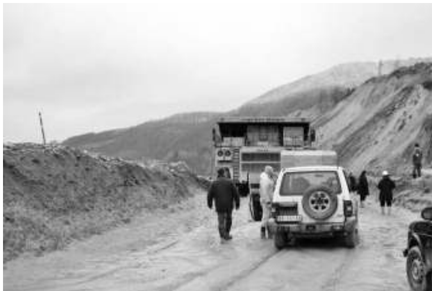
Место несреће у РБМ

У пожару у неготинском насељу Вељко Влаховић