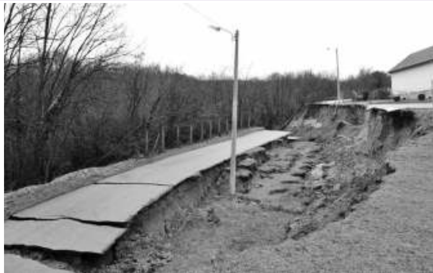
Прорадило клизиште у Јабуковцу

- Треба, такође, водити рачуна да уколико дође до ширења ка објекту да се неким мерама за-