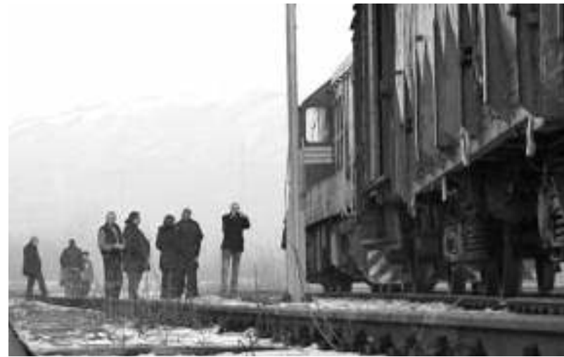
Увиђај на пруги