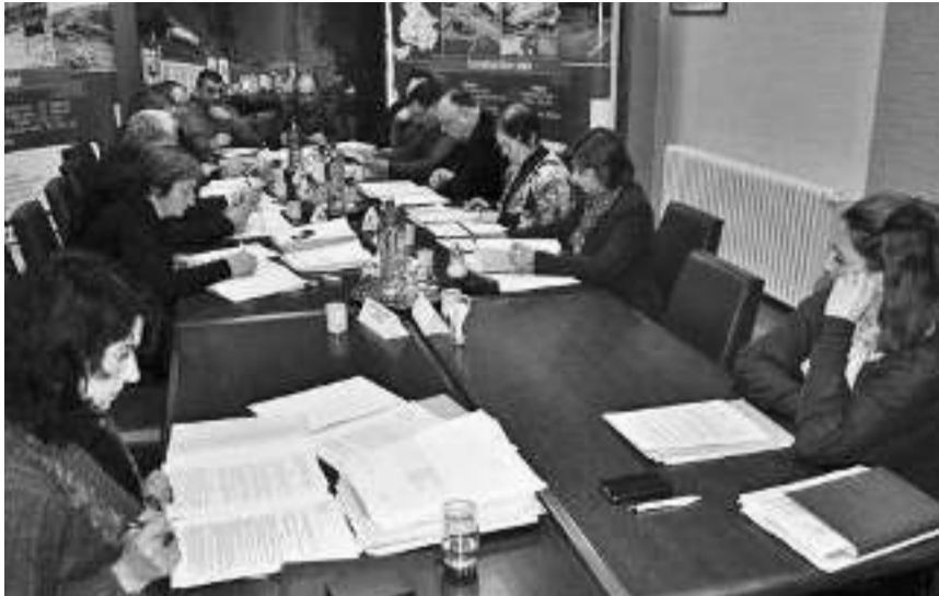
Књажевачки већници усвојили 25 тачака

КЊАЖЕВАЦ - На дневном реду 97. седнице књажевачког Општинског већа било је 25 тачака, а најважније теме биле су Финансијски план општине за 2015. годину, као и планови набавки општине и општинске управе за ову годину.