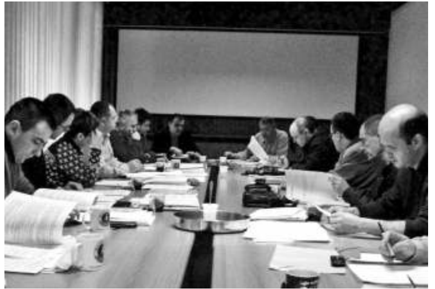
Седница мајданпечког Општинског већа

Затечене околности из неког претходног времена представљају озбиљно ограничење, о чему сведочи ад на пример, у ЈП за грађевинско земљиште и путеве је чак 24 од 36 радника "на минималцу". Говорило се и о директорским платама од само 36 хиљада динара у појединим јавним предузећима, а везано за пословање ЈП "Водовод" закључено да се од Агенције за приватизацију затражи да се имовина и опрема од значаја за водоснабдевање Мајданпека пренесе општини или овом јавном предузећу, како би се створили услови да оно функционише како треба.