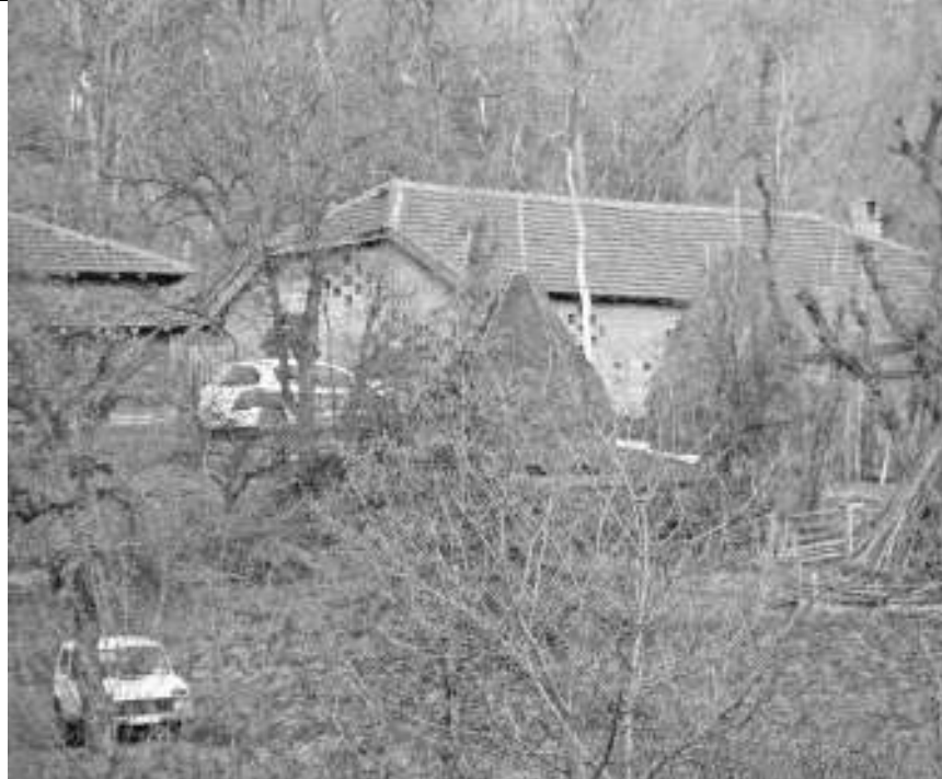
Увиђај на појати код Злота

И, остале комшије ове породице су, најблаже речено, у шоку. Кажу, ништа није упућивало на то да ће