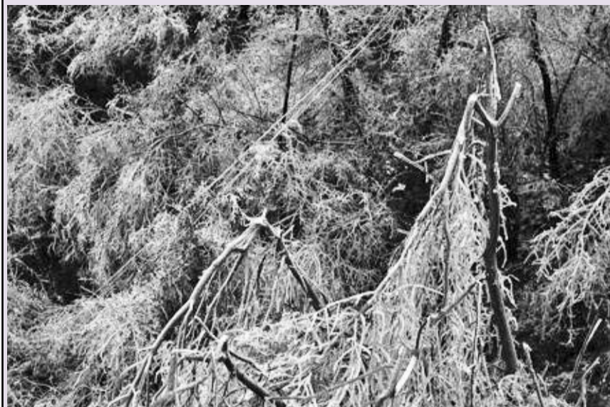
Зима узела данак

Према прелиминарним подацима, угрожена је површина од 18.419 хектара државних шума, са укупном запремином од 456.326 кубних метара дрвета и 23.886 хектара шума сопственика са укупном запремином од 266.065 кубних метара. И.Л.