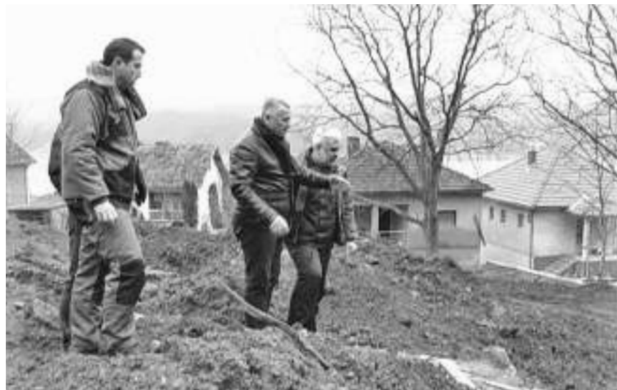
Министар Илић у Текији

КЛАДОВО - Интензитет радова на три локације у општини Кладово, које су највише биле оштећене у прошлогодишњим поплавама, подигнут је на виши ниво и то ме радује и храбри да се сложен посао може завршити у планираном року - изјавио је министар без портфеља задужен за ванредне ситуације, Велимир Илић после обиласка градилишта на изградњи одводног колектора за прихват бујичних вода у оквиру пројекта заштите насеља Текија.