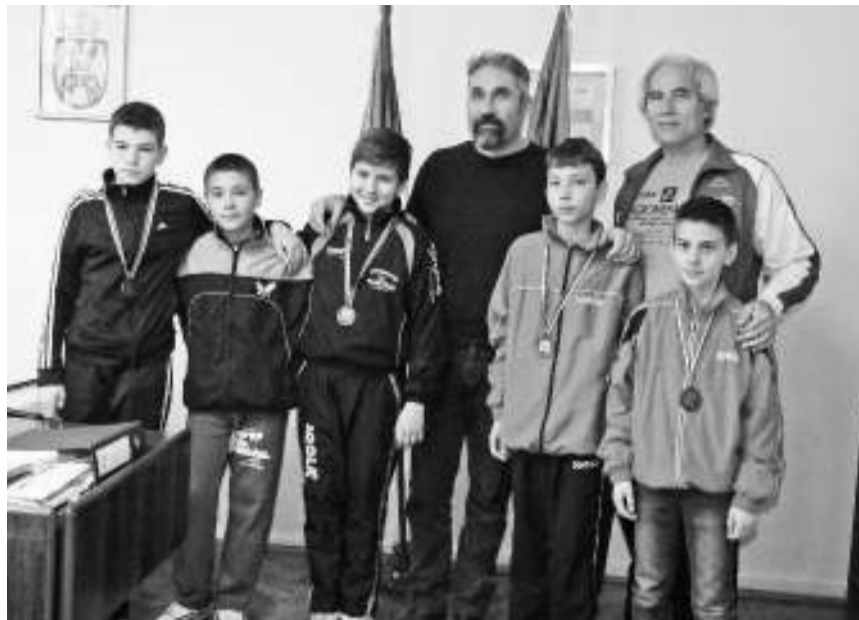
Стонотенисери са председником општине Неготин

- Наши стонотенисери су освојили велики број медаља на школским, регионалним и државним првенствима у појединачној и екипној конкуренцији. На државном првенству освојене су четири медаље у екипној категорији у конкуренцији млађих кадета и једна медаља у конкуренцији кадета, док су такмичари нашег клуба на првенствима Централне Србије екипно и појединачно освојили преко 30 медаља. Стонотенисери су освојили и 10 медаља на међународним такмичењима, а редовно се неколико њих налази у