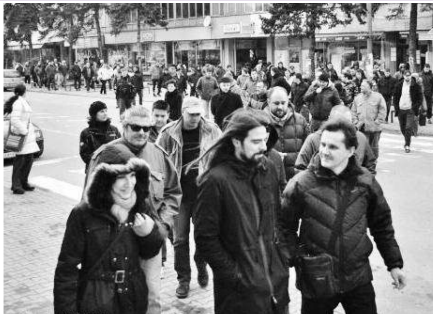
Протест због чесми

Он додаје да град Зајечар није надлежан за коришћење подземних недубинских вода, већ је надлежност на нивоу државе. Каже да је за опрему грејања од Владе добио субвенционисани кредит у износу од 30.000 евра.