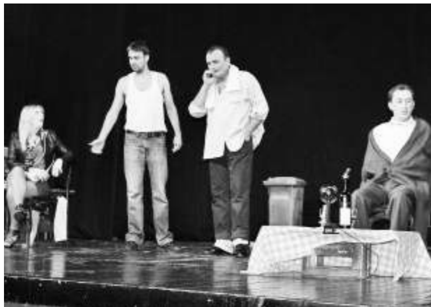
Детаљ из представе "Соко зове орла"