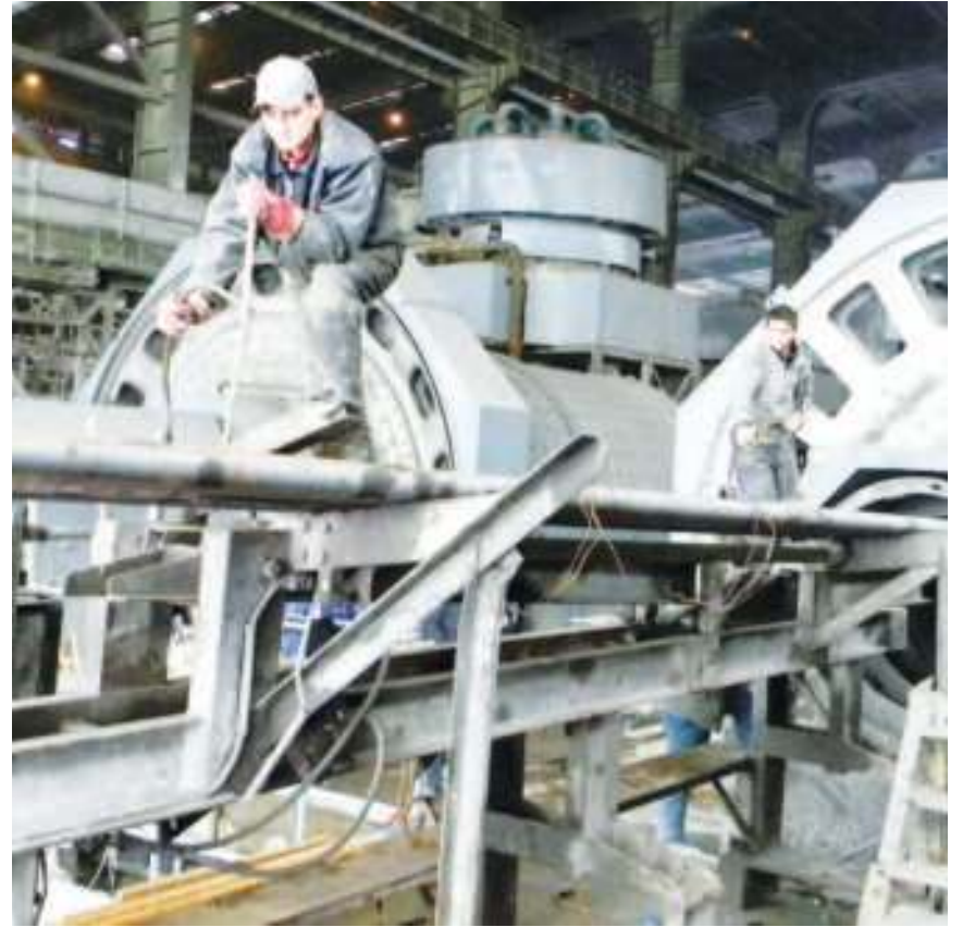
Радови у РБМ биће окончани до краја месеца

Упоредо са убацивањем механизма, у Руднику бакра Мајданпек су предвидели да и подизвођач преосталих радова, АТБ ФОД Бор, већ ових дана започне радове за инструмен-