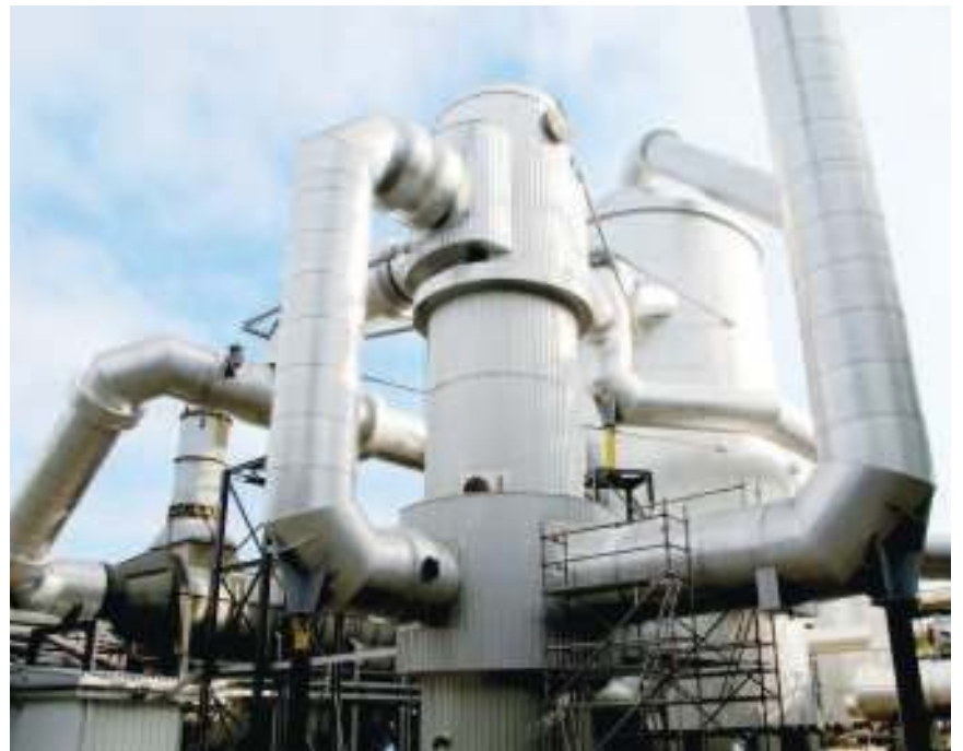
Детаљ из фабрике сумпорне киселине