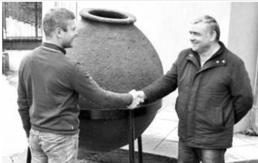
Један од експоната

То је случајан налаз сарадника музеја који је случајно отишао да набере коприве, а пронашао – мач. Ради се о средњевековном мачу који припада, како нам је потврђено из пожаревачког музеја, групи српских мачева. То су потврдили археолози из Бора, а његова старост се процењује на око 12 до 15 века. Детаљније анализе ће са већом прецизношћу одредити његову старост и друге