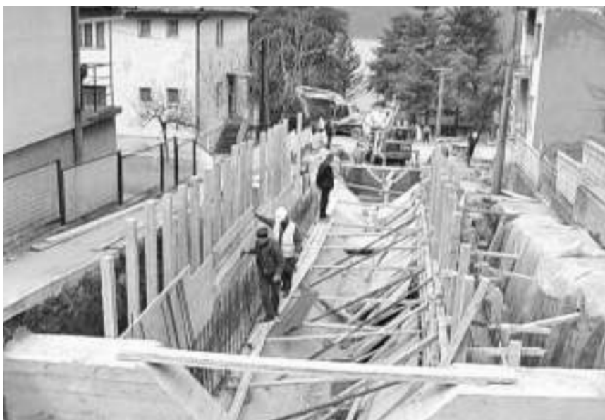
Изградња колектора у Текији

КЛАДОВО - Грађевинска оператива предузећа АД "Ђердап-услуге" приводи крају радове на из-