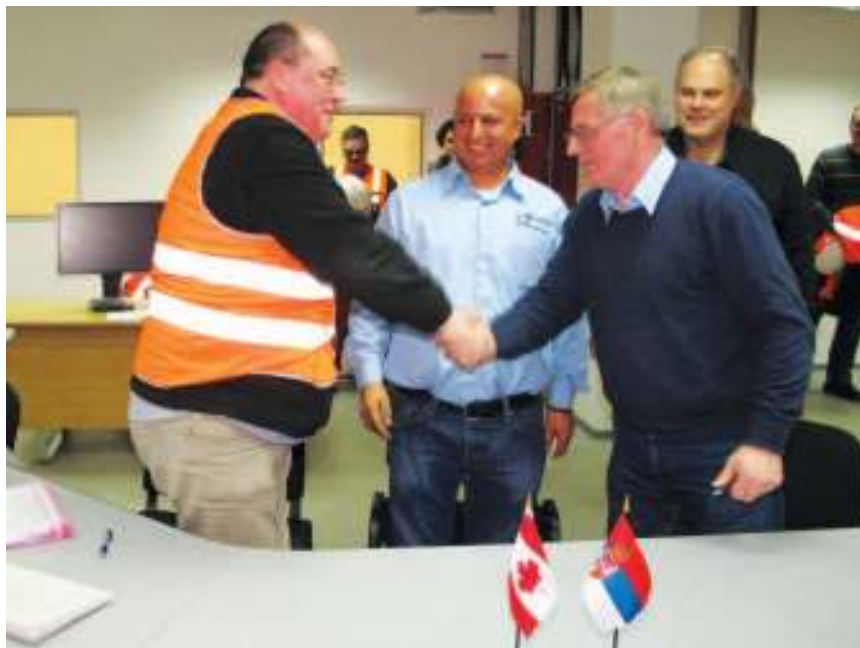
Постројење предато РТБ

Потписано писмо о намерама са НЕПЦ о изградњи когенеративног постројења