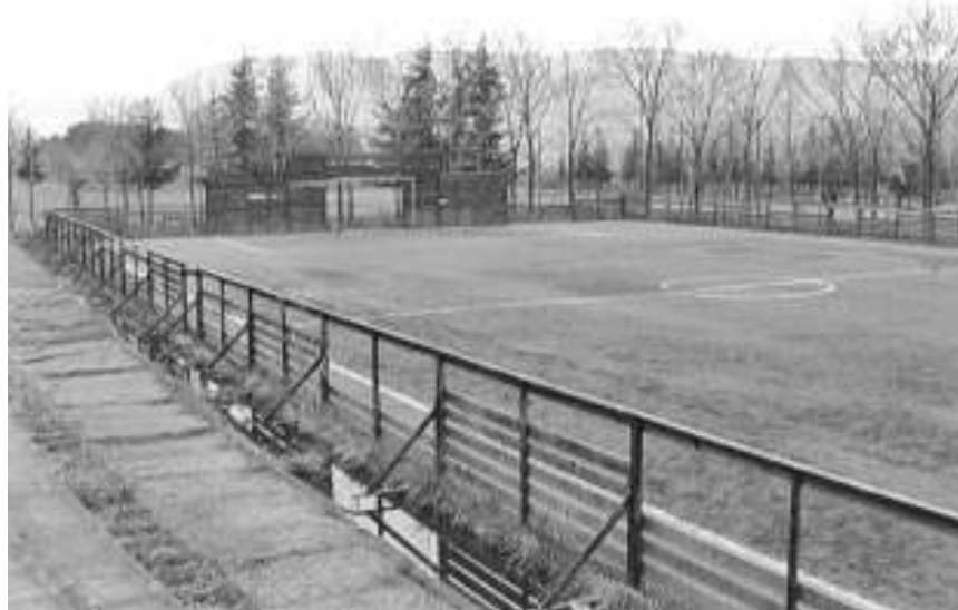
Спортски камп у Караташу