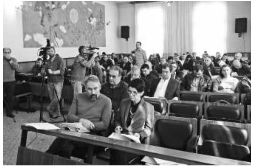
Седница СО Неготин

Одборници, њих 40 присутних, већином гласова усвојили