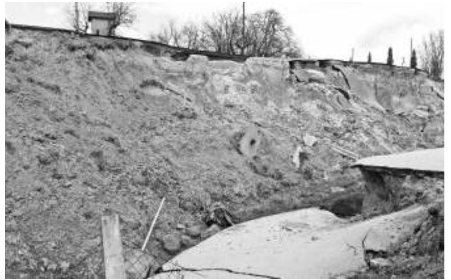
Клизиште у Јабуковцу

Од децембра се ово клизиште због снега и обилних падавина активирало неколико пута стварајући бројне пукотине на старом регионалном путу и узбрдо од потока ка платоу. Дубина клизишта, које се према причи мештана први пут активирало педесетих година прошлог века, али у знатно мањим размерама, према последњим мерењима је преко пет метара, што изискује озбиљније захвате. У ком ће