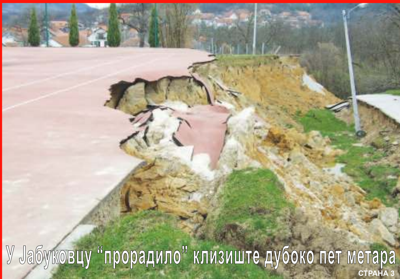
У Јабуковцу “прорадило” клизиште дубоко пет метара