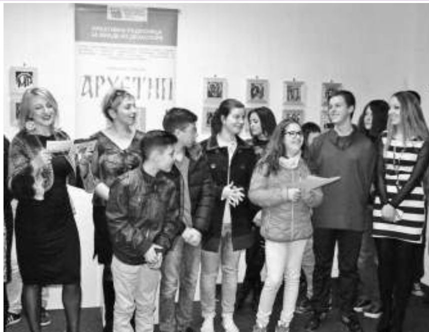
Учесници пројекта "Архетип"

Упознавали су историју ћириличног писма, учили су ћирилицу и исписивање свог имена и презимена, као и својих иницијала кроз лепо, калиграфско исписивање и израду монограма кроз сликарску технику или у везу. Учили су текст и музику химне „Боже правде“ као и песме из овог краја. Гости су били и ученици из Музичке школе „Стеван Мокрањац“ и из „Неготинске гимназије“, а и сами учесници су свирали и певали – истичу организатори радионица.