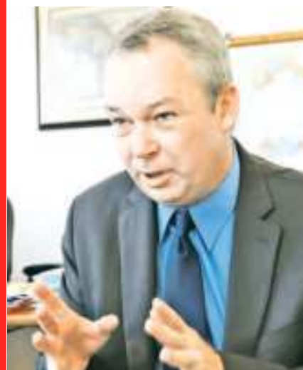
Тони Верхејен, шеф Канцеларије Светске банке у Србији