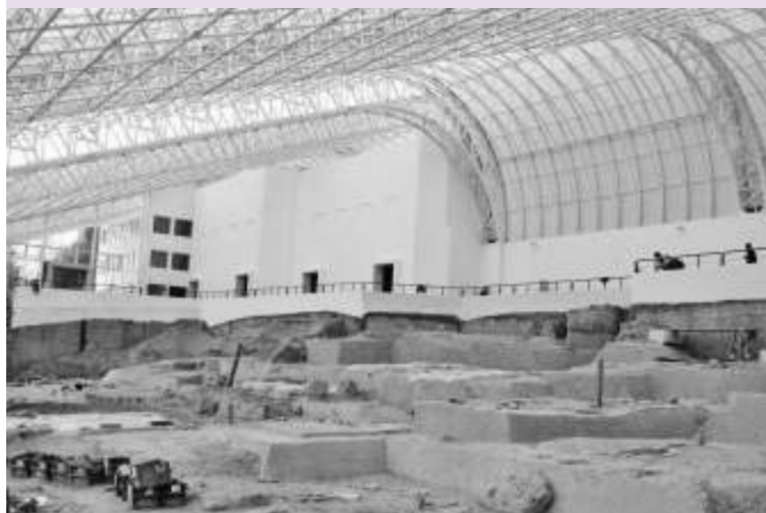
Музеј "Лепенски вир"

МАЈДАНПЕК - Општина Мајданпек привела је крају реализацију пројекта климатизације Центра за посетиоце на Лепенском виру. "Туризам ближи кориснику" је пројекат прекограничне сарадње суфинансиран из средстава фондова Европске уније, који се реализује у партнерству са општином Димово у суседној Бугарској. Вредан је око 68 милиона динара, колико је општина Мајданпек у последњих годину дана уложила у његову реализацију, очекујући рефундирање доброг дела тих пара.