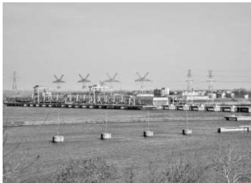
ХЕ “Ђердап 2”

- Од првих дана на “Ђердапу 2” се остварују значајни резултати, али 2014. је дефинитивно година апсолутног рекорда од почетка рада наше