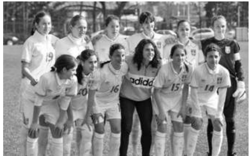
Репрезентација младих до 16 година

Првенство централне Србије обележио гест борског кикбоксера