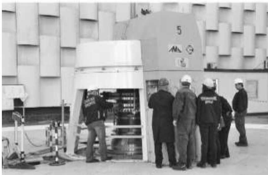
"Подмлађени" агрегат у ХЕ "Ђердап 1"

Јавни увид у Нацрт овог документа и поменути извештај траје до 15. априла. Своје примедбе физичка и правна лица могу доставити у писаној форми током трајања јавног увида, а Јавна седница комисије за јавни увид је заказана за 20. април у просторијама Општине, са почетком у 12 сати. Тој седници ће уз представнике локалне самоуправе присуствовати и представници обрађивача, суботичког "GeoEXPERT". С.В.