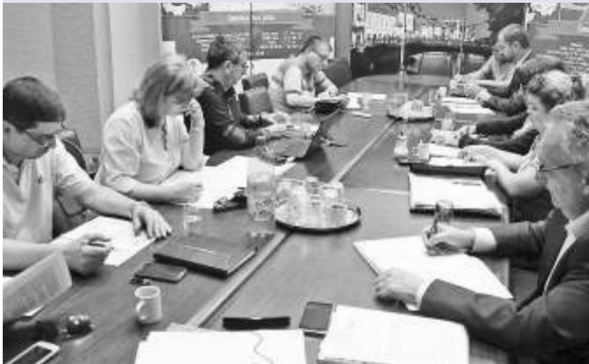
Састанак поводом депоније Халово

КЊАЖЕВАЦ - У Књажевцу је одржан састанак Координационог одбора за реализацију споразума о заједничком управљању чврстим комуналним отпадом за седам општина Тимочке крајине.