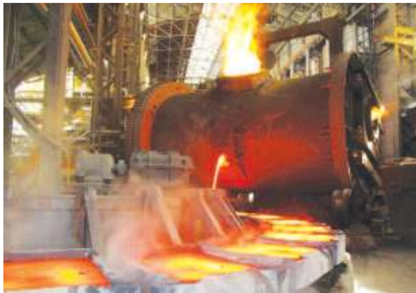
Изливање анода у Топионици

У погону електролизе радиле су 284 ћелије, па је произведено 2.440 тона катодног бакра. Очекује се да укупна априлска производња буде око 2.750 тона катода. Погон старе енергане радио је стабилно и припремао продукте за остале погоне ТИР и за градску топлану. Ливница бакра и бакарних легура произвела је 181 тону за 27 дана априла, па се очекује укупно око 200 тона одли-