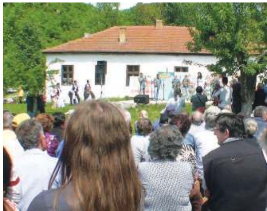
Манифестација одржана у Балта Бериловцу

Манифестација "Молитва под Мицором", која сваке године окупља велики број посетилаца из целе Србије, настала је на теме-