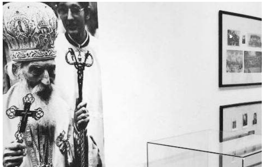
Детаљ са изложбе