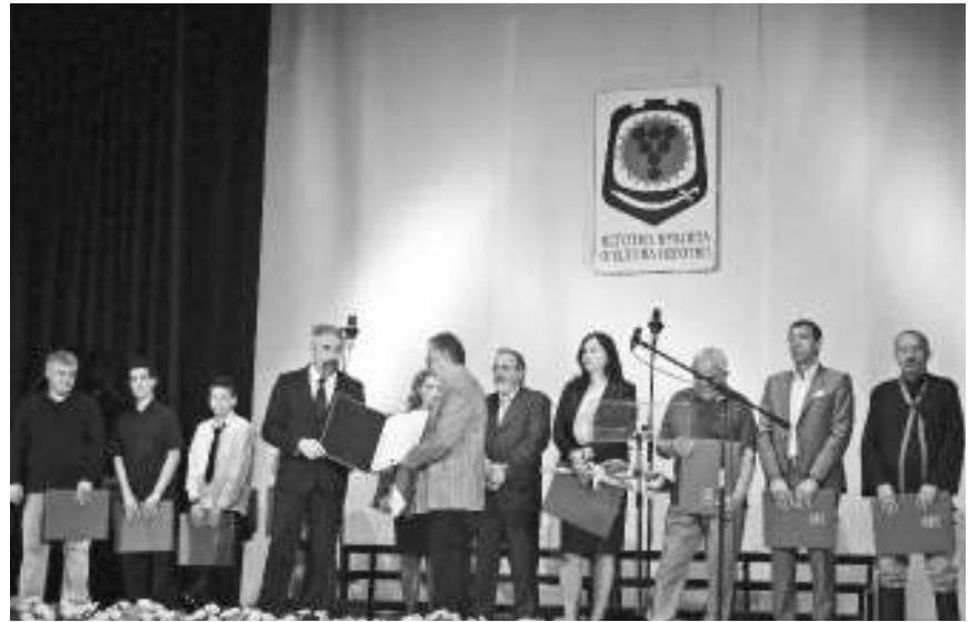
Свечана седница СО Неготин

- Жеља нам је да и у наредном периоду наставимо у истом