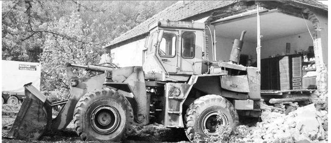
Машина се забила у кућу