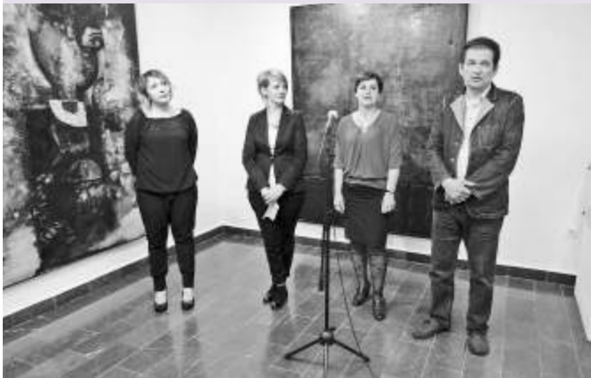
Са отварања изложбе

КЊАЖЕВАЦ - У галерији Завичајног музеја у Књажевцу отворена је изложба слика из легата Лазара Возаревића.