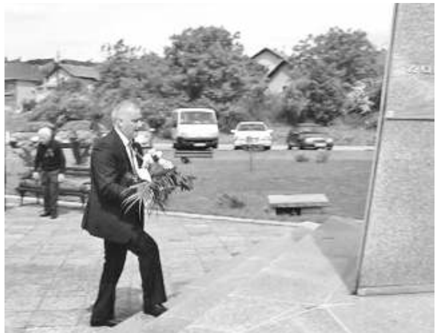
Арежина полаже цвеће на споменик

- Док на Црвеном тргу у Москви српски гардисти достојанствено корачају у војној паради поводом седам деценија од ослобођења Европе од фашизма, ми смо у Вајуги одакле се 1944. године кренуло, заједничким снагама црвеноармејаца и српске војске, у народноослободилачку борбу. Само један људски век треба се вра-