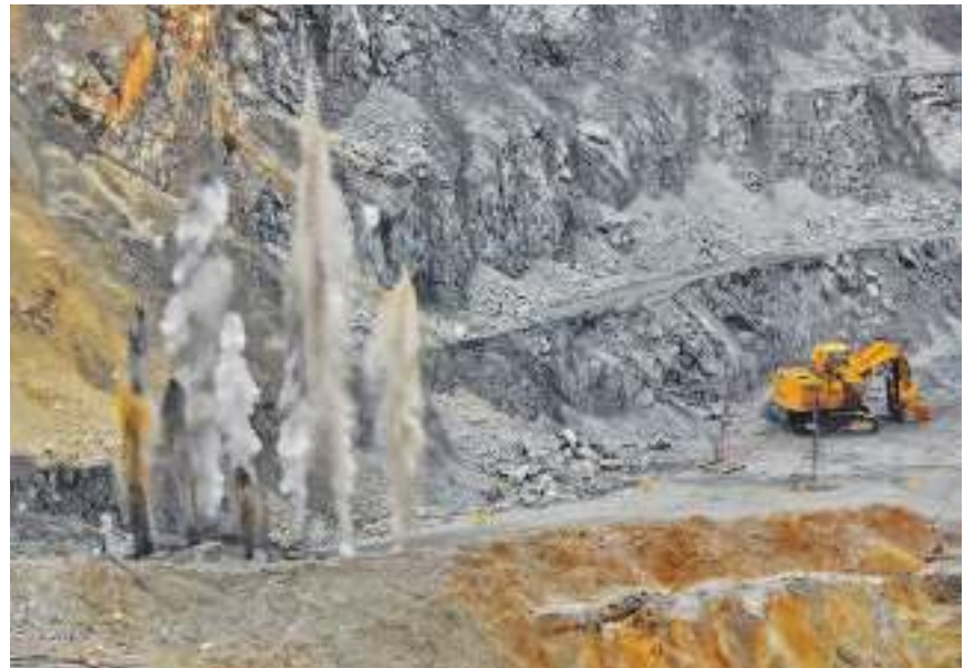
Минирање на Северном ревиру

- Хаварија на Транспортном систему 1 (пуцање осовине на затезном бубњу траке