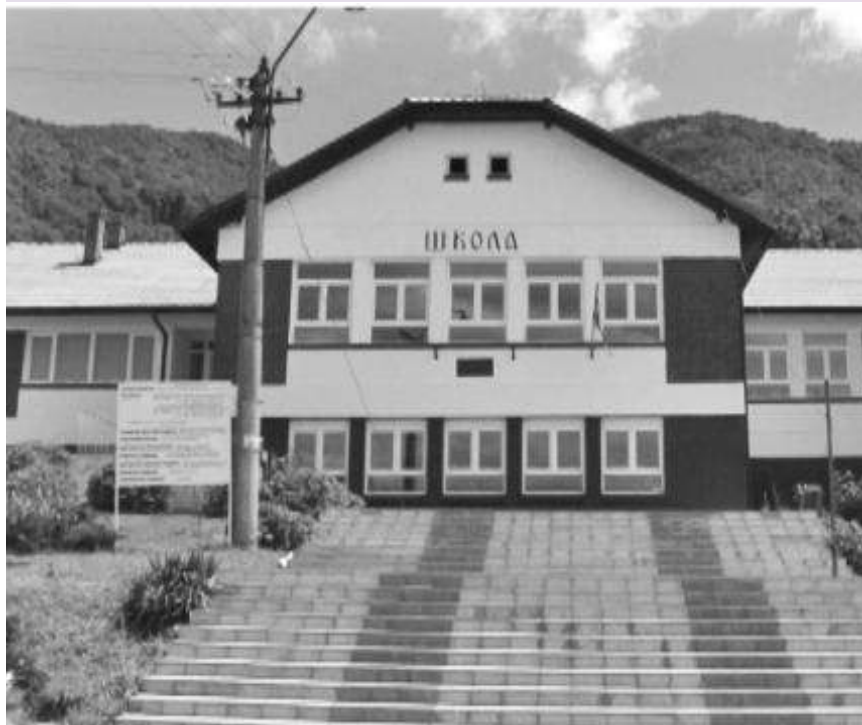
Одмичу радови на школи у Текији

КЛАДОВО - У основној школи "Светозар Радић" у Текији приводе се крају санациони радови на објекту који се 15. септембра претходне године нашао на удару бујичних поплава. То је разлог што је у школској години на измаку 55 ђака од првог до осмог разреда наставу похађало у Кладову.