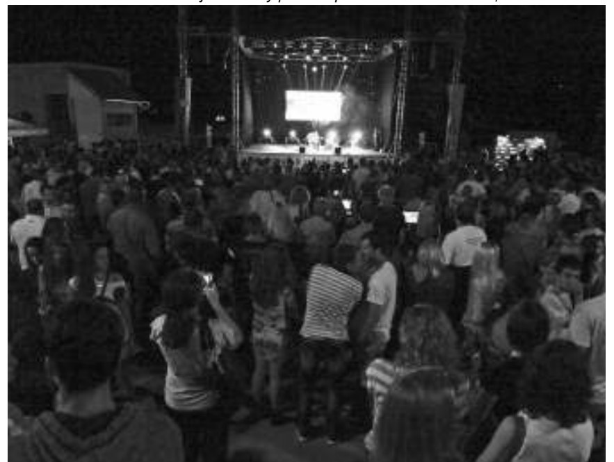
Детаљ бса прошлогодишњег ФКМС