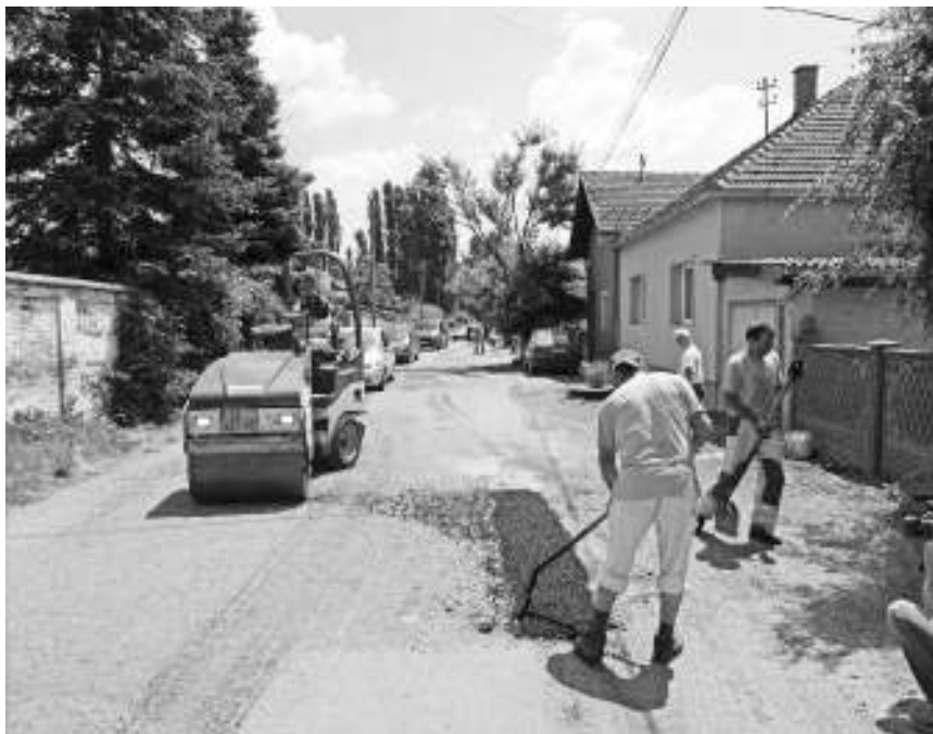
Посао вредан осам милиона динара

- Радове изводи Предузеће за путеве из Зајечара на основу спроведене јавне набавке. Процењени обим радова је осам милиона динара, а понуда ПЗП Зајечар износи