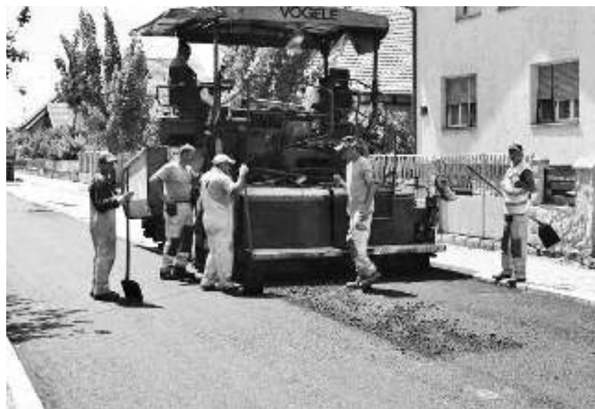
Радови у Сокобањској улици