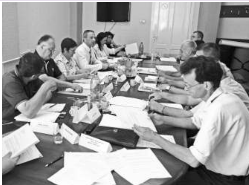
Седница ОВ у Књажевцу

- Њихов законски рок је да одговоре у року од 15 дана, а ми смо шест месеци чекали њихов одговор - огорчен је председник општине Књажевац. - Ребалансом смо створили услове да распишемо нови јавни позив, за који се надамо да ће бити успешан. Ако све буде како треба, од средине августа би требало да профункционише бесплатан превоз за све