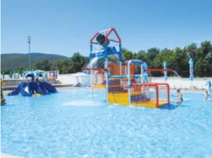
Аква парк у Сокобањи на мети туриста

СОКОБАЊА - Аква парк "ПОДИНА" је од центра Сокобање удаљен 1,5 км и изграђен је у оквиру спортско-рекреативног комплекса Подина. Овај забавни водени комплекс изграђен је на површини од 16.000 м 2 и може да прими око 2.000 посетилаца. Комплекс садржи полуолимпијски базен са спортском опремом, купалиште за одрасле и децу,