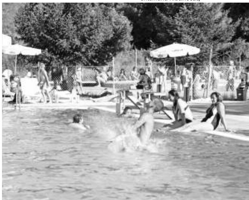
Бањица се водом снабдева из Ргошке бање