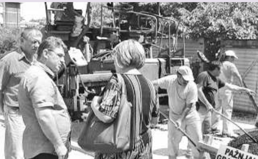
Уграђено 100 тона асфалта

КЛАДОВО - Радници предузећа за путеве "Штрабаг" асфалтирали су 400 квадрата приступне саобраћајнице до новог паркинг простора код зграде у Улици "Стефаније Михајловић" и такозване нише за уздужно паркирање возила код објекта предшколске установе "Невен".