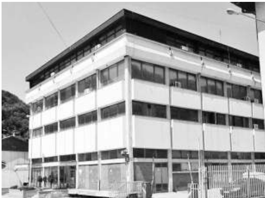
Почетна цена за ИПМ је близу три милиона евра

Агенција је објавила да се јавни позив објављен 27. маја мења у ставу који се односи на процењену тржишну вредност имовине на крају прошле године која је, према извештају овлашћеног проценитеља, нешто мања од три милиона евра. Зато је и почетна цена за продају имовинске це-