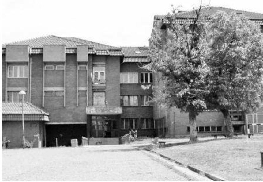
Завод за васпитање младих у Књажевцу

Несрећни дечак је испричао инспекторима да су га