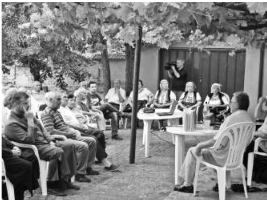
Једна од промоција у Историјском архиву у Неготину