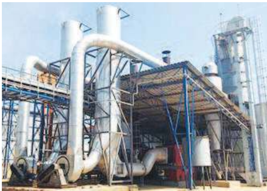
Фабрика за производњу пелета

БОЉЕВАЦ - Најмањи тимочки град Бољевац има тек нешто више од три хиљаде становника, али и моћну планину Ртању у залеђу са очуваном природом и обиљем руда, шума, пашњака и чистих извора здраве воде. И управо то богато залеђе, све већи број инвеститора последњих година, туризам у замаху, успеси машинаца и сточара и легенде о ртањским летећим тањирима, ванземаљцима и чудотворним афродизијачким травкама буде наду да Бољевцу може да буде и боље.