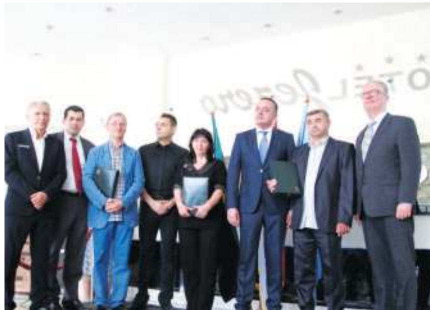
Добитници награде инжењер Шистек са министрима и високим гостима