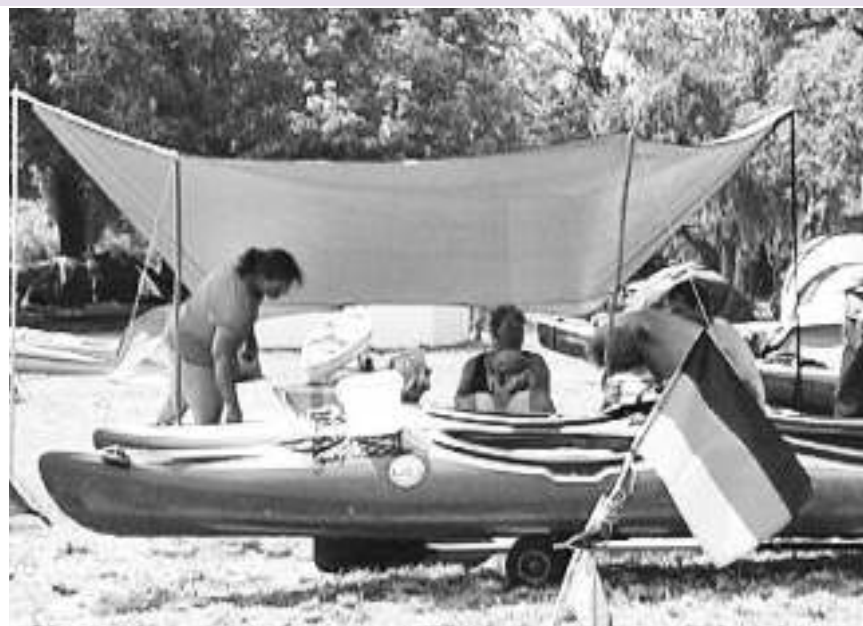
Кајакаши предахнули у Кладову

из других земаља, пролазак кроз непознате и предивне пределе једноставно оплемењује. На том путу Србија је најлепша. Нисам уморна, а за сада нема ни жуљева - поносно истиче на препланула Немица