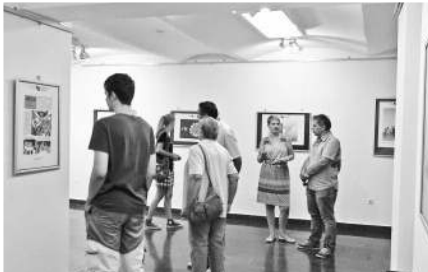
Изложба у Књажевцу

- Предрасуде су велике и ми то свакодневно чујемо од обичних људи. Један од основних начина у борби са предрасудама је размена информација, али и смех и карикатура могу много да помогну. Уосталом, и неки од водећих политичара ЕУ били су карикатуристи, а најбољи пример за то је премијер Аустрије, који је некада и сам цртао карикатуре о придруживању Унији, док се данас налази на челу Владе једне од земаља - чланица - додаје Стефановић. Из ЕУ Инфо кутка Ниш најављују да ће у Књажевцу приредити изложбу карикатура са овогodiшњег конкурса, као и да сарадњу са нашом општином намеравају да прошире на организовање фестивала европског филма крајем лета. Љ. П.