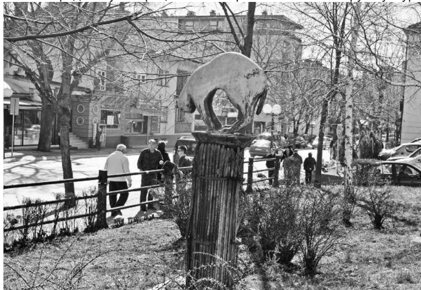
Почело копање бунара у Корбову