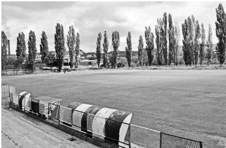
Стадион ФК Бор

Само три клуба могу да рачунају на тражени износ