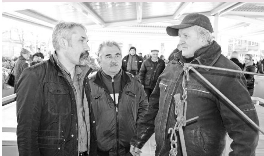
Пијацу обишао председник општине Неготин

НЕГОТИН – После више од две и по године чекања Неготинци су коначно добили реконструисану и модерну зелену пијацу са 270 тезги и млечном пијацом на којој ће се продавати месо, сир, млечни и производи од јаја и теста. Нова пијаца опремљена је тезгама са затвореним боксовима у којима ће закупци моћи да складиште своју робу, док је посебан објект млечне пијаце опремљена са 40 расхладних витрина. Уз простор за пољопривредне производе, сезонско цвеће и расад, надлежни су одвојили и 10 места за малу занатску пијацу. Уз то Зелена пијаца у Неготину добила је и нови санитарни чвор, наткривену металну конструкцију са лексаном која ће закупце тезги штитити од кише и снега, као и подну облогу. Уз две нове капије, прилазне путеве, Зелена пијаца је добила и нову расвету и видео надзор. Радно време у зимском периоду је до 17, а у летњем до 20 сати. Након тога се капије закључавају.