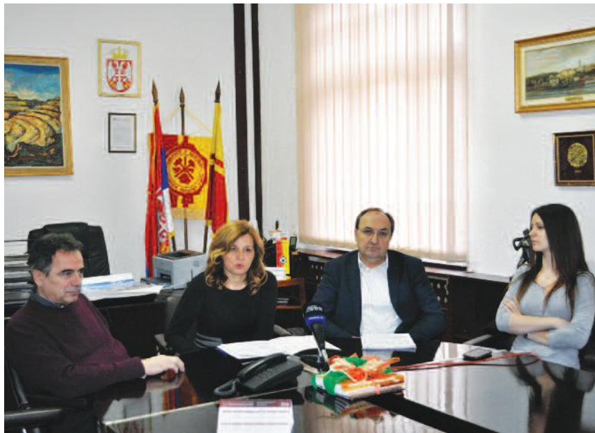
Са конференције за новинаре