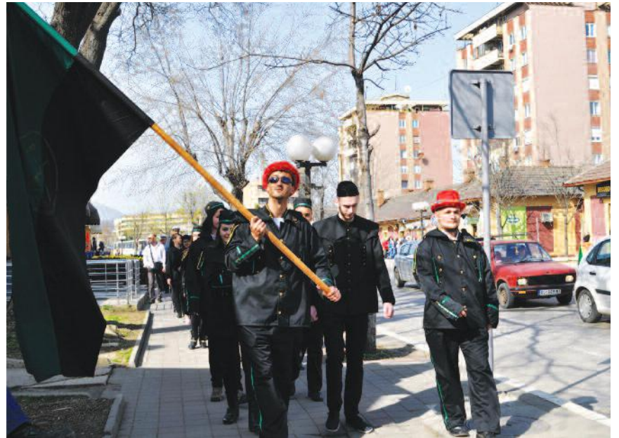
Бруцоши у потрази за бруц мајором

- Бруцоши, кандидати за будуће рударе траже бруц мајора који ће их повести на церемонију односно промоцију у звање рудара. Организована је и позоришна представа у биоскопу „Звезда“, као и две изложбе и студентски бал. Скок преко коже симболизује спремност будућих рудара да прескоче окно. Како су окна бивала све шира и на њима изграђивани излазни торњеви,