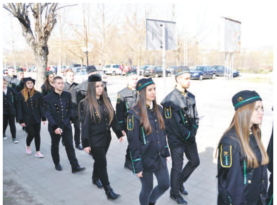
Шетња бруцоша главним улицама Бора