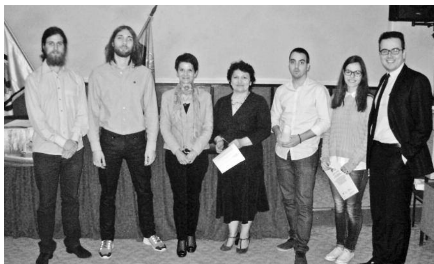
Награђени најбољи студенти

Пројекат "Неготин на путу транспарентног, економског, инфраструктурног и стабилног развоја" суфинансира Општина Неготин