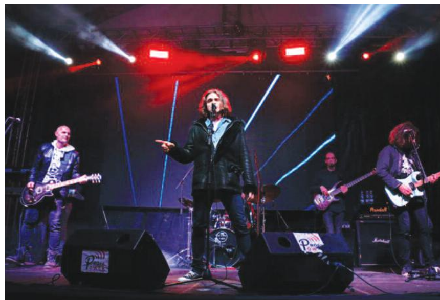
Милиграм бенд наступио у Сокобањи

- Први пут смо свирали у Сокобањи. Публика је имала