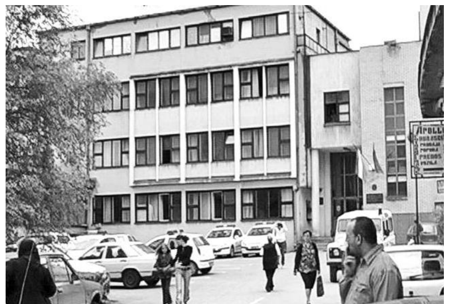
Зграда ПУ Бор

Шеснаестогодишњи младић ће се бранити са слободе, саопштила је полиција. Д.К.