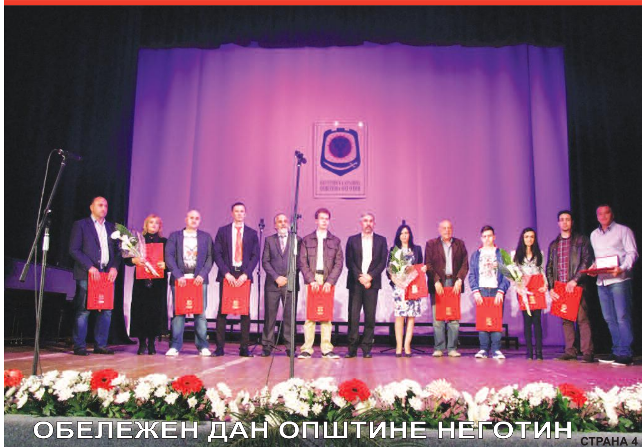
ОБЕЛЕЖЕН ДАН ОПШТИНЕ НЕГОТИН