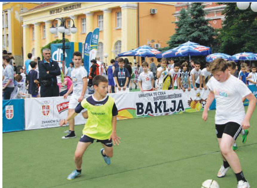
У Кладову се дружила фамилија Букатаревих

Компанија Фриком је припремила изненађење за све љубитеље спорта и на тржиште лансирала сладолед Бакљу освежавајућег укуса наранџе у јединственој амбалажи Олимпијске Бакље са поклон лоптицом скочицом. Сви малишани, који воле спорт и навијање, могу да пошаљу поруку подршке свом омиљеном спортисти користећи код из сладоледа, а најкреативније очекује лепо изненађење.