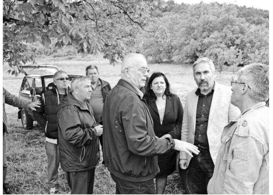
Усвојена допуна одлуке о висини цена услуга у ПУ „Бамби“