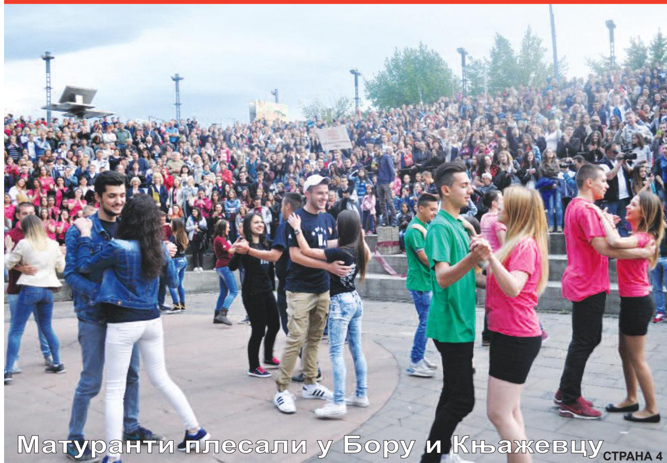
Матуранти плесали у Бору и Књажевцу