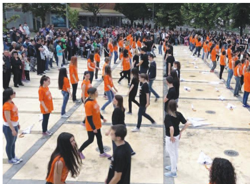
... и у Књажевцу