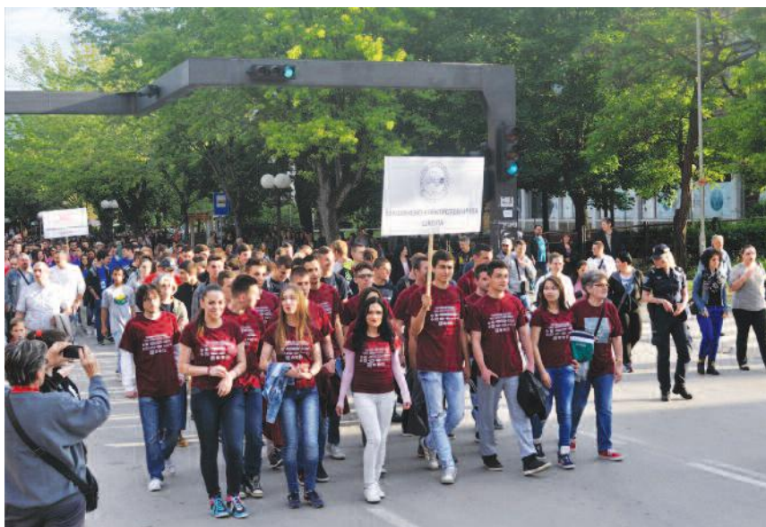
Матуранти у Бору...

- Ово је јако лепа манифестација коју смо сви заједно припремали. Доста смо вежбали и трудили се да увеличамо овај догађај. Осећања су ми помешана, радујем се што сам за-