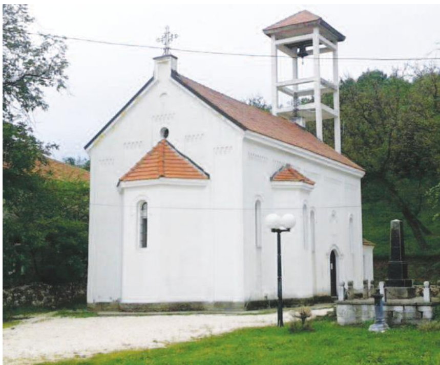
Храм Свете Тројице у Доњој Белој Реци

„Овом донацијом желели смо да пружимо подршку очувању наше вере и традиције, али и да допринесемо завршетку обнове храма. Са задовољством ћемо и у будућ-