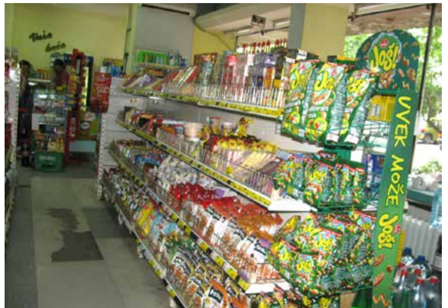
Фото: Једна од Центроистокских продавница - архива Борског проблема

- То је то битно да бисмо ове године кренули у реконструкцију зелене пијаце. Радимо и пројекат за буваљу пијацу и простор где је шљака који ћемо комплетно асфалтирати, поставити тезге и уредити како продавци своју робу не би више излагали на улици. Остало је да решимо питање Капије Бора где је у градском власништву 1200 метара квадратних, борски гигант има 550 квадрата, и Енергопројекат 4400 квадрата. Неопходно је да се поново уради пројекат изведеног стања објекта јер не постоји физичка подела тог простора већ на основу квадратуре, након чега ће се разграничити коме шта припада. Интерес нам је да и Капију Бора ставимо у функцију. Енергопројекат нуди на продају свој део, а ми нећемо избегавати да по најпо-