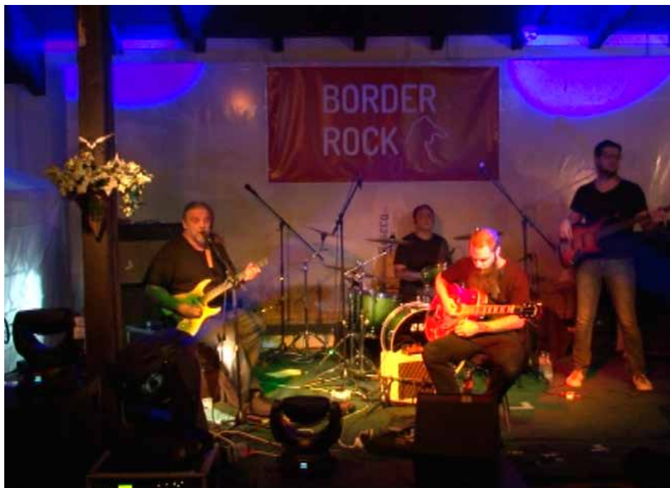
Фото: Први Бордер рок фестивал у Кладову

КЛАДОВО - После етно и Бордер рок град на Дунаву овог августа добио је још један феастивал „Denub fun fest“. Реч је о ревијалном фестивалу ди џејева и музичких група који је намењен младима. У врелим августовским ноћима Кладовљанима и њиховим гостима