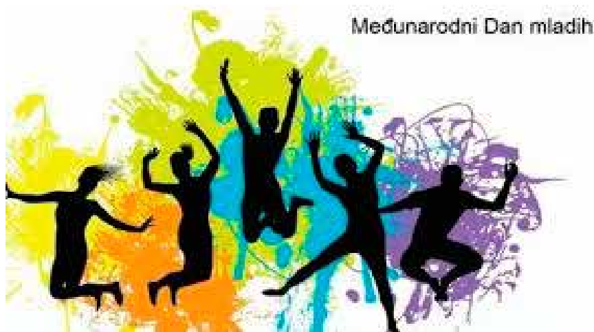
Međunarodni Dan mladih

На иницијативу Уједињених нација сваке године 12.-ог августа обележава се „Међународни дан младих“. Овај важан датум има за циљ да укаже на значај улоге младих људи у друштву, као и да се млади подстакну на организовање активности у циљу скретања пажње јавности о свом положају. Такође, ово је јединствена прилика за све који имају интерес да се уједине и осигурају да млади буду укључени у доношење одлука на свим нивоима.