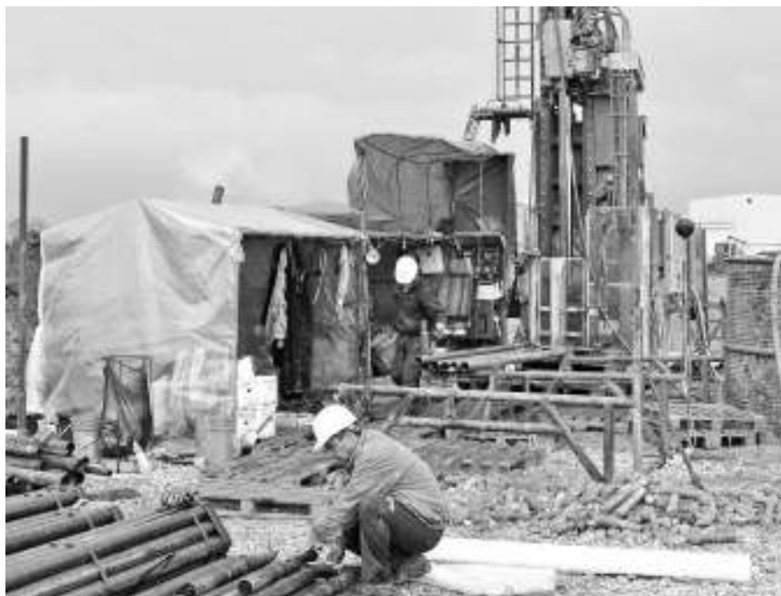
Геолошка истраживања код борског аеродрома

Већ наредне године, "Фрипорт" почиње подземна истраживања, како би тачно одредили величину лежишта и садржај руде у њему. Кожељ је додао да "Фрипорт" тренутно има три истражна права у околини Бора, али и да се нада да ће им будућа истраживања омогућити да добију право да