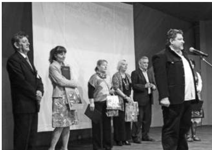
Са отварања изложбе "Жене сликари"