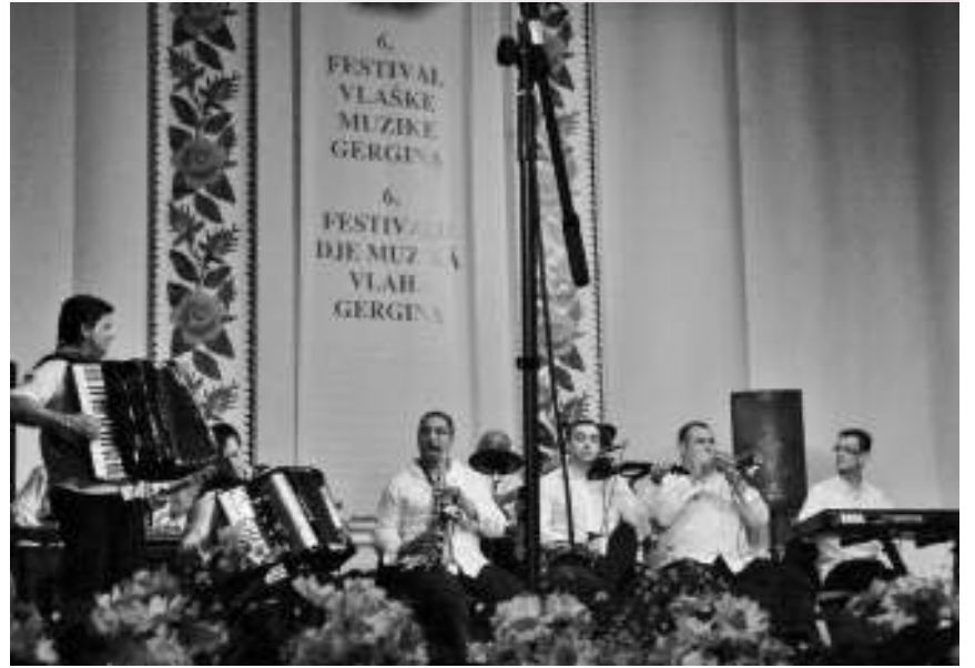
Са Фестивала влашке музике