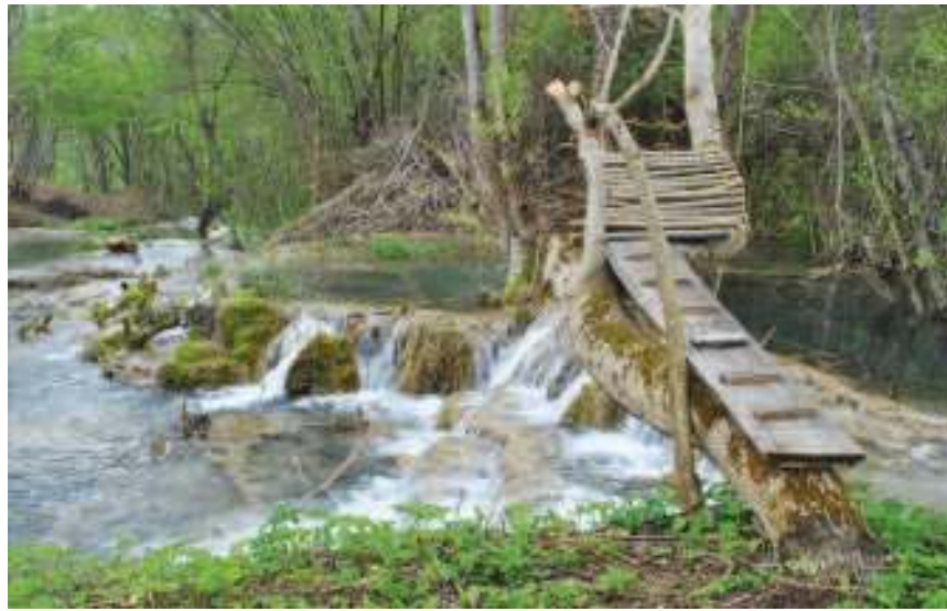
Водопад на Старој планини

Водопад је висок 35 метара и једно је од чуда природе на Старој планини. Прави рај за туристе, и ретко ко остаје равнодушан пред призором моћне воде, која се уз хук стропоштава са планинске литице. Мало ко зна да се овде крије још један бисер, а то су касканда - кречњачка