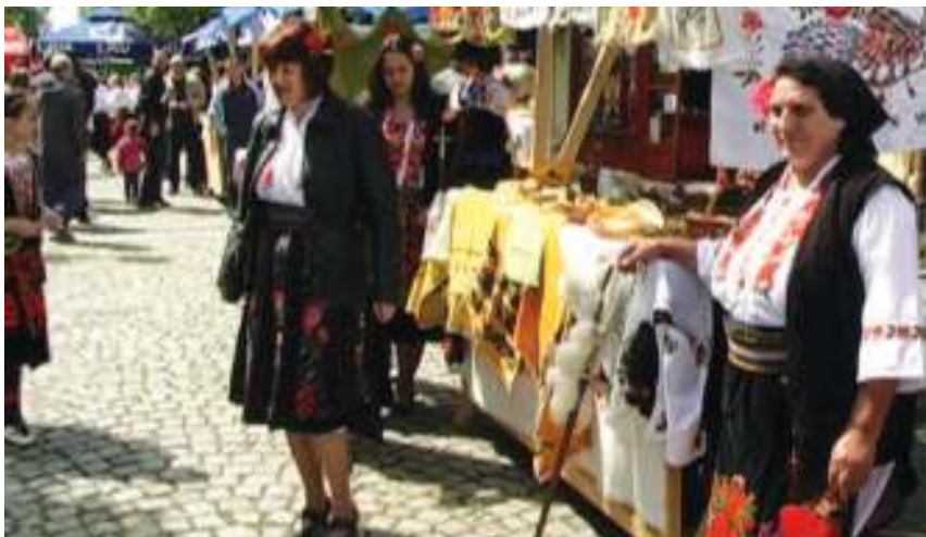
Гости у Старој чаршији

КЛАДОВО – Овогодишња туристичка сезона у општини Кладово отворена је манифестацијом "Весела чаршија". На десетак штандова у Старој чаршији, која је одувек била жила куцавица и трговачко-угоститељско средиште вароши на крајњем истоку Србије, организатори су посетиоцима подарили богатство различитости кладовског краја.