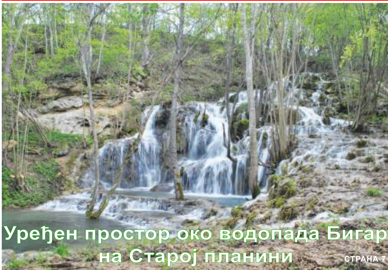
Уређен простор око водопада Бигар на Старој планини