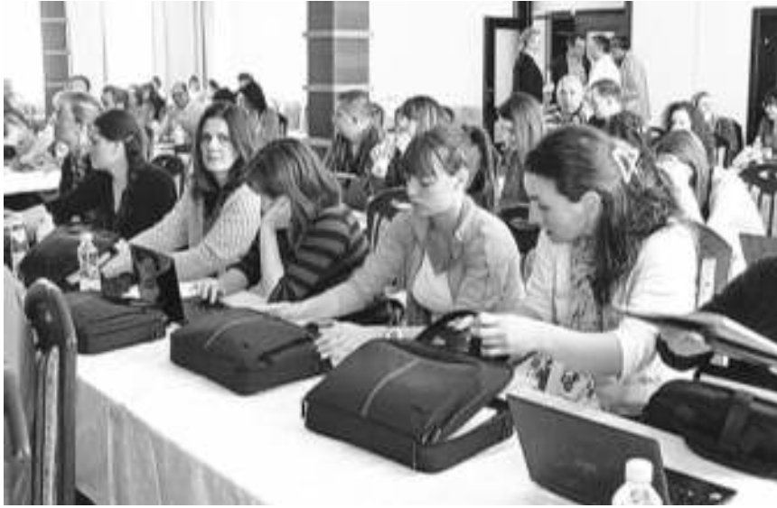
Са семинара у Кладову

КЛАДОВО - На основу Законских одредби о званичној статистици, Републички завод за статистику спровешће током маја и јуна "Анкету о приходима и условима живота" на територији целе Србије. Тим поводом у Кладову је одржана инструктажа за анкетаре, вође тимова и контролоре. Истраживање ће бити спроведено на узорку од 8.000 домаћинстава и користиће се за добијање структурних социјалних индикатора. Подаци прикупљени током анкете биће објављени у посебном извештају Републичког завода за статистику.