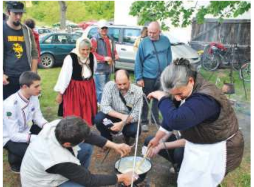
Такмичење у припремању старих јела