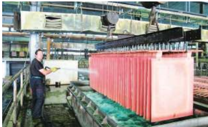
Детаљ из Електролизе

Када је реч о осталим производима из асортимана Електролизе, четворомесечни рапорт карактеришу учинци већи од предвиђених. Прођуковано је 435 тона плавог камена или 11,5 одсто више од плана за ову годину. Почетком априла обављен је седмодневни ремонт, и то без ангажовања тзв. трећих лица, него су сав посао завршиле службе машинског и електроодржавања. У наредном периоду овде је планиран и један већи захват – ремонт комплетне центрифуге, како би фабрика била потпуно оспособљена. У РЈ за производњу племенитих метала биле су три кампање прераде прженца. Параметри рада су добри, јер је крајем прошле године завршено детаљно президавање "доре"-пећи, тако да је линија топљења у пуној погонској спремности. Производња сребра, платине и паладијума кретала се у планираним границама, злата изнад, док је код селена забележен највећи скок од чак 30 одсто.