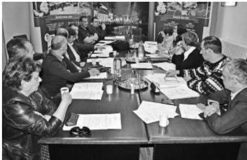
Седница Штаба за ванредне ситуације

- Могуће је да дође до замућења, због овако великих