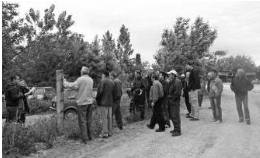
Радници спречили судске извршитеље да уђу

Бивши радници су, том приликом, са фирмом закључили споразум по којој ће своје тужбе којим потражују заостале плате од-