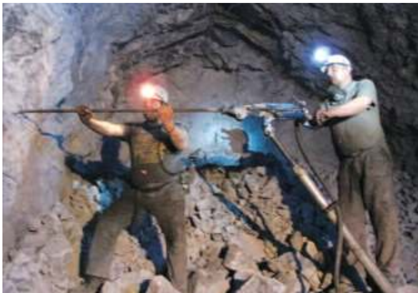
Радови на 19. хоризонту

- Напредујемо нешто спорије него што смо рачунали – каже Фуфановић. - Са горње стране проблем је одвоз руде, а са доње сваки метар ходника мора да се осигурава мрежама и анкерима. Одоздо смо касније кренули и због тога што смо морали да раставимо утоварач у делове, да га спустимо кроз окно од 80 метара и поново саставимо како бисмо њиме радили. Он ће ту остати и по завршетку нископа и служити за претовар руде. Ових дана смо оформили и четврту смену како би се радови убрзали, али је снабдевање репроматеријалом, а и сам одлазак на доње радилиште и даље компликован. Међутим, искори-