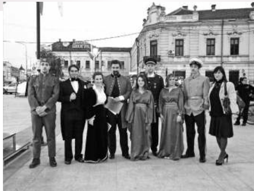
Познати Неготинци у I светском рату

На Сајму туризма, а у оквиру овог пројекта биће одржана још два у Турну Северину и Темишвару. Представиле су се угости-