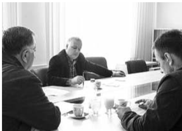
Са седнице Општинског већа у Кладову

- Општинско веће је одреговало како би покренуло поступак јавне набавке за куповину више ракета. Процедuru смо овом одлуком тек започели. Закони који дефинишу општински буџет не предвиђају издвајање средстава у ове сврхе, тако да