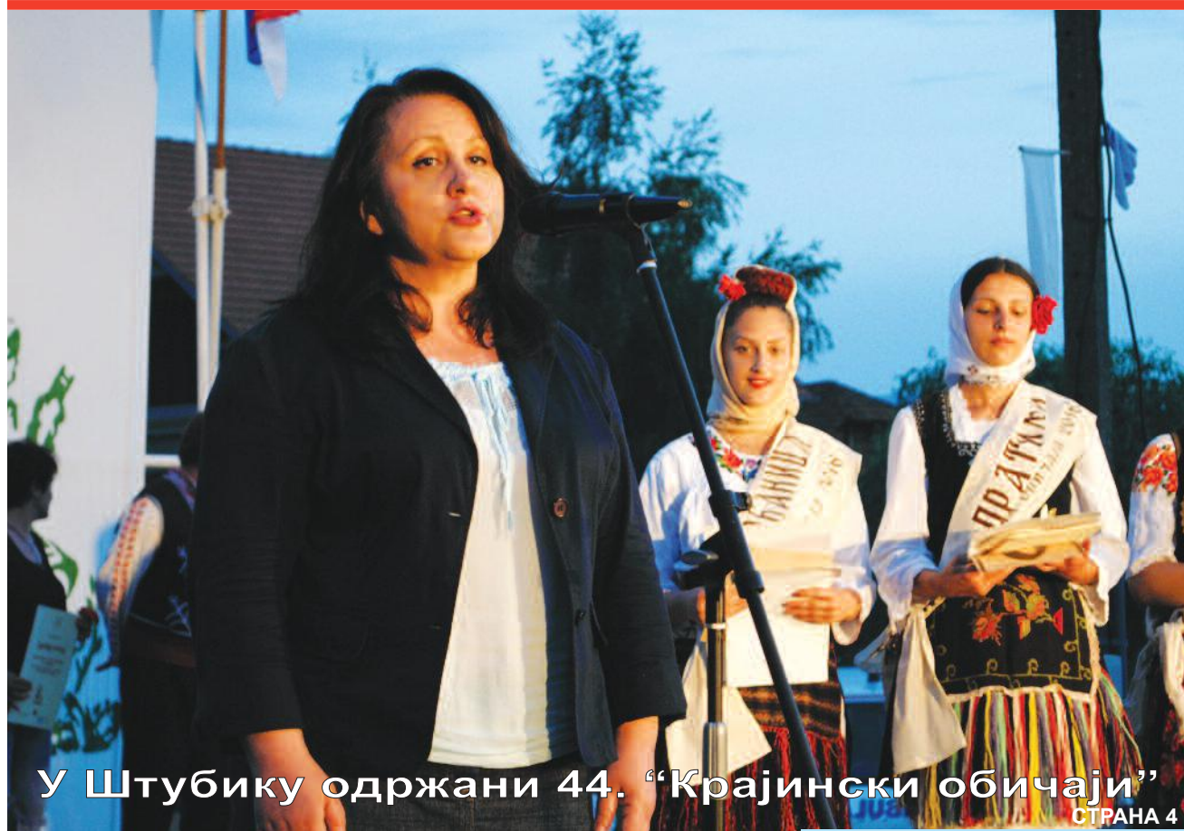
У Штубику одржани 44. "Крајински обичаји"