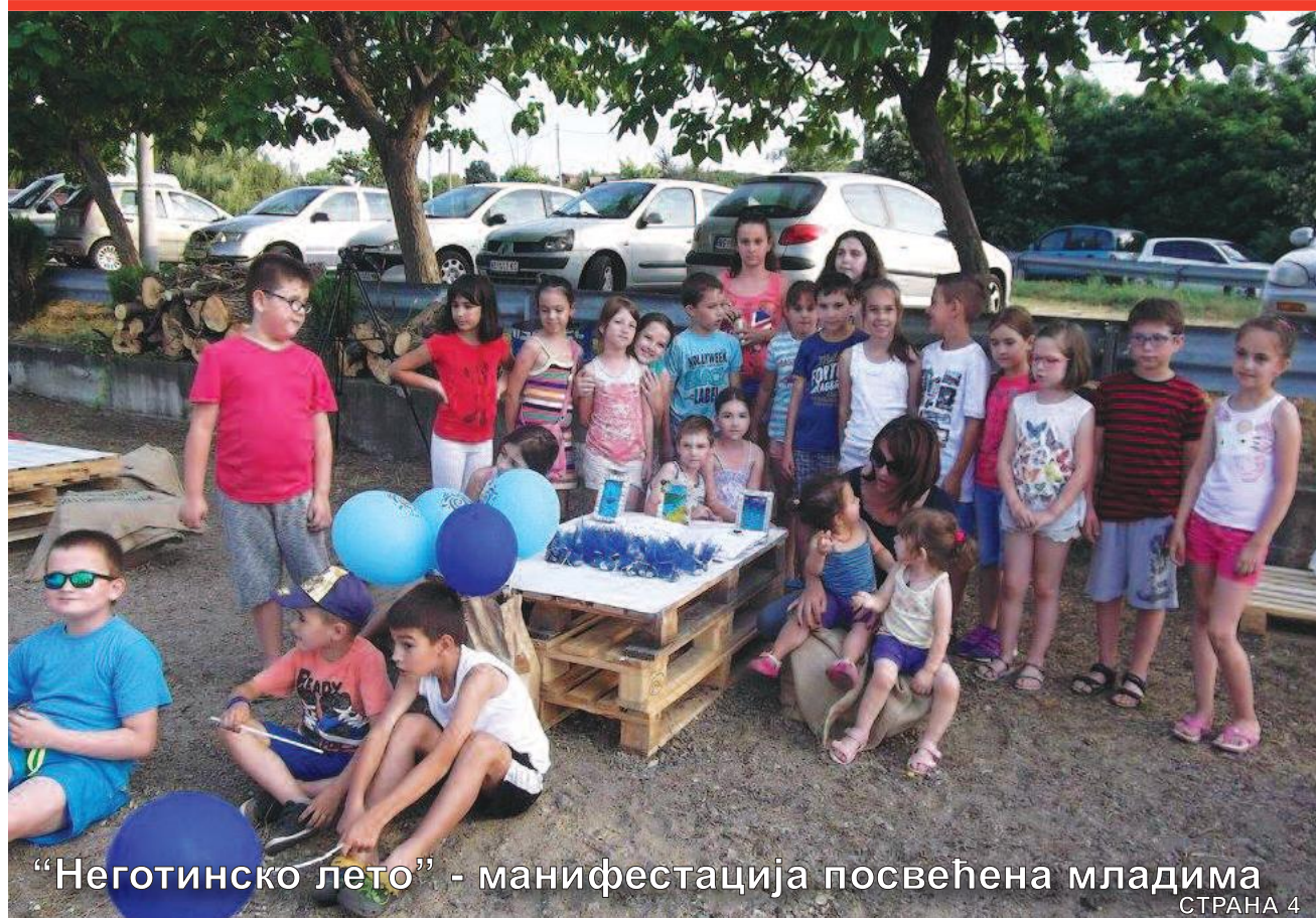
“Неготинско лето” - манифестација посвећена младима