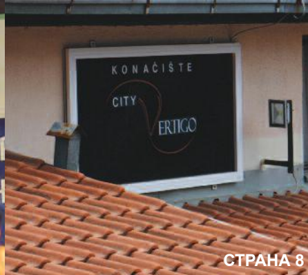
“Вертиго” – туристичка вртоглавица на Борском језеру