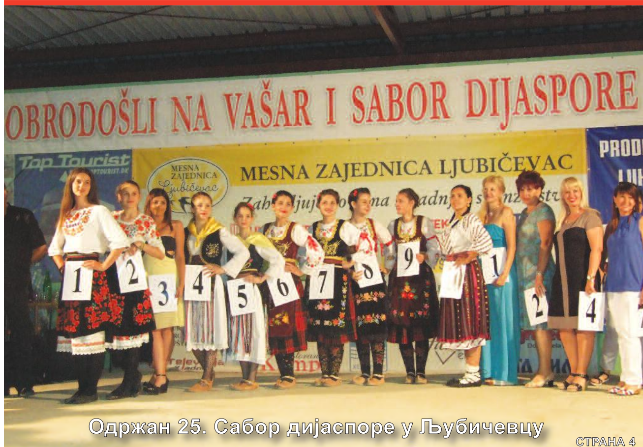
Одржан 25. Сабор дијаспоре у Љубичевцу