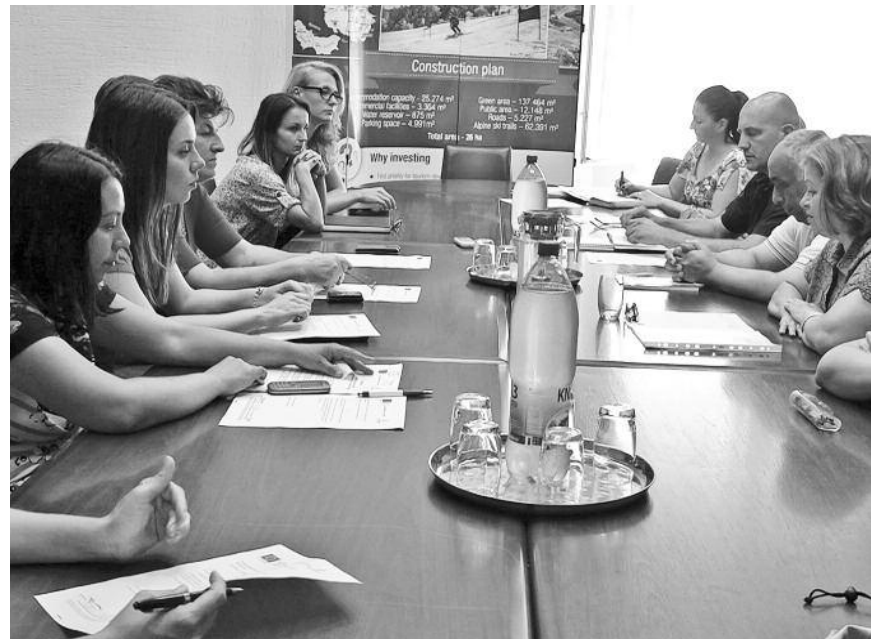
Јавни увид у Нацрт Измена и допуна Плана генералне регулације насеља