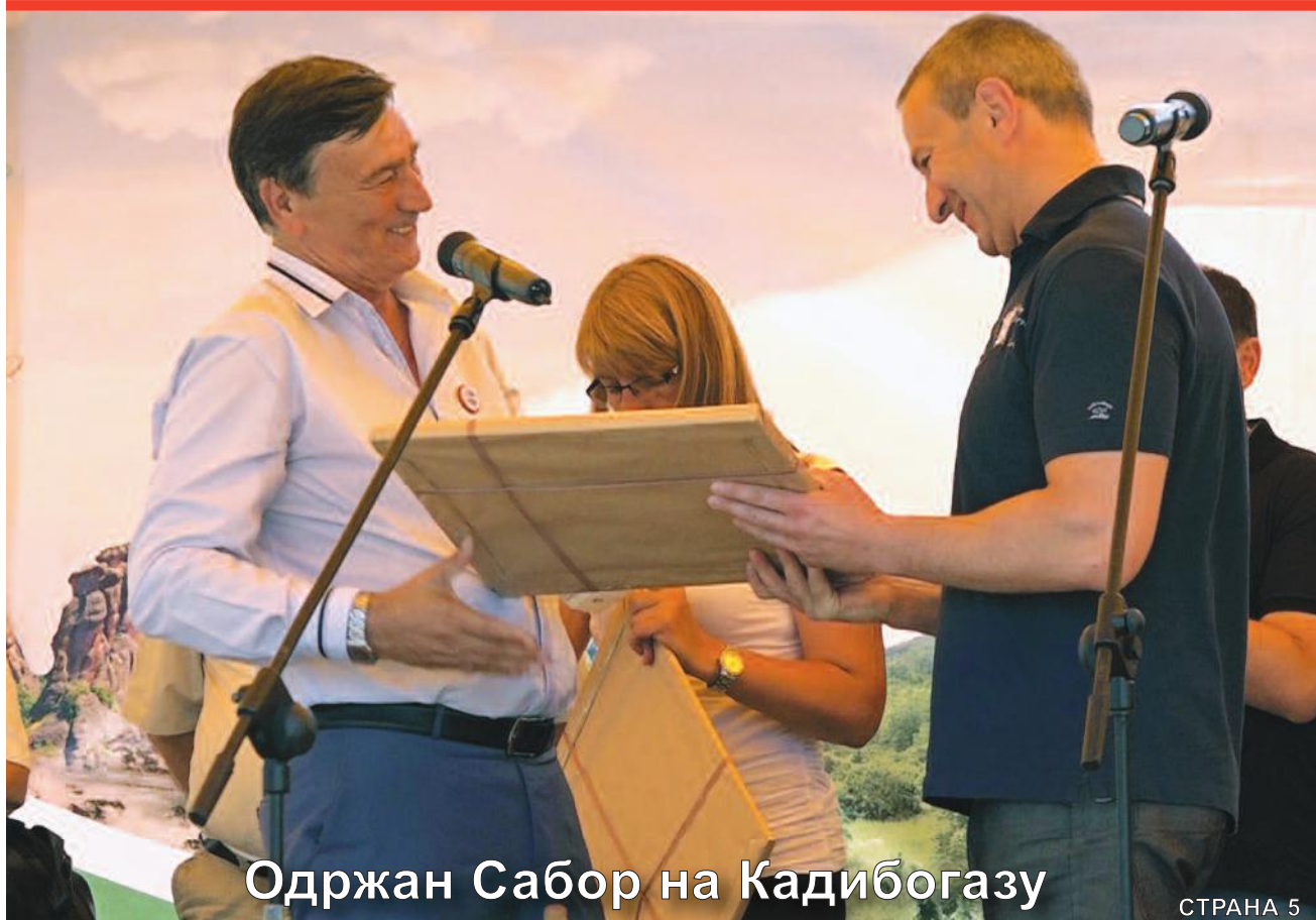
Одржан Сабор на Кадибогазу