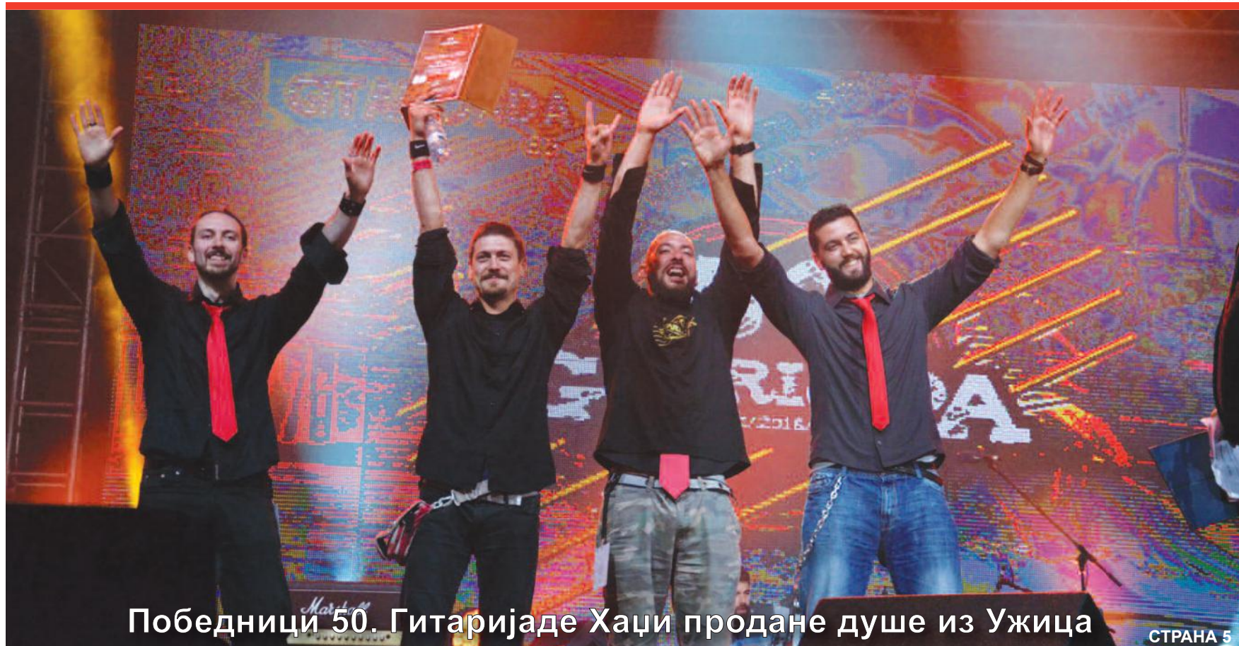
Победници 50. Гитаријаде Хаџи продане душе из Ужица