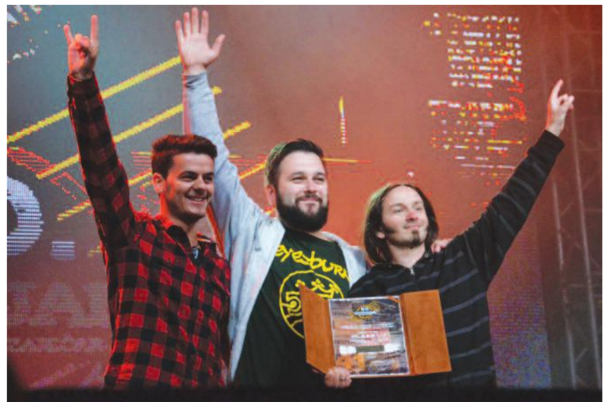
Победници публике - "LSD" из Бањалуке

Осим такмичарских, зајечарска публика громогласно