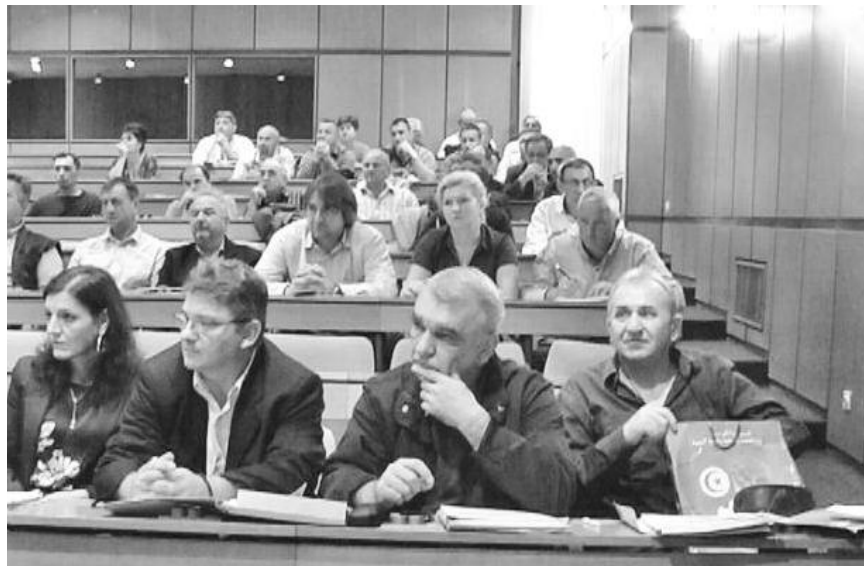
Са седнице СО Кладово

КЛАДОВО - На седници Скупштине усвојен је Извештај о реализацији буџета општине Кладово за првих шест месеци ове године. Буџетски приходи износе 269,7 милиона динара и реализовани су са 42,9 одсто од плана. Расходи и издаци буџета општине Кладово у периоду јануар- јун су мањи за шест милиона, јер износе 263,7 милиона динара односно 38,9 одсто од плана.