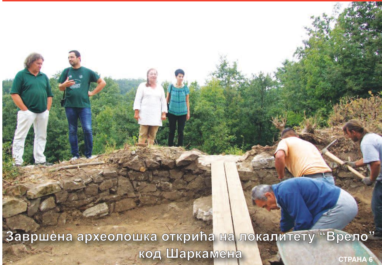
Завршена археолошка открића на локалитету "Врело" код Шаркамена