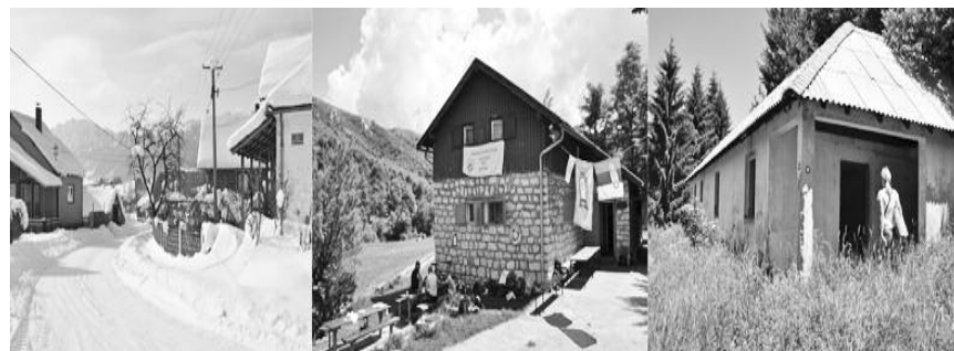
Горњане, Стоп, Дубашница: Природне лепоте без дестинација

4. Имиџ – јединствени карактер, углед и слика дестинације на тржишту је пресудна у привлачењу пажње потенцијалних гостију. Није довољно да дестинација располаже квалитетним асортиманом атракција и пратећим погодностима уколико потенцијални посетиоци нису свесни тога. Поред јединствености, атрактивности и знаменитости дестинације, важну улогу у њеном имиџу имају и квалитет животне средине и брига о њеном очувању, безбедност, ниво и квалитет услуга, љубазност домиционог становништва и др. У стварању и одржавању имиџа дестинације велику улогу имају активности маркетинга, е – маркетинга, брендирања, па и лобирања, и наравно – медији. Као и у другим делатностима, тако и у туризму, добар имиџ је нешто што се ствара годинама, деценијама, а може се срушити у трену. Зато се овој осетљивој категорији мора поклањати велика и константна пажња, како би се из ње извукле што веће користи.