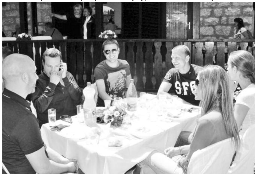
Новинари београдских медија (јул 2014.): Људи имате све и немате ништа

Туризам је једна од ретких (ако не и једина) делатности у којој је пракса развијенија од теорије. На пример, људи су прво изучили основе математике и физике па су кренули да праве мостове и облакодере. Дакле, теорија па пракса. У туризму су ствари другачије – људи су прво почели да путују, да би знатно касније то путовање ради задовољства привукло пажњу теоретичара. Туристичка теорија се често код нас сматра непотребном, али су у развијенијим земљама давно схватили да се само квалитетним планирањем туристичког развоја могу осигурати најпозитивнији ефекти тог развоја, и минимализовати негативне последице. Један од најбитнијих елемената у том планирању свакако су туристичке дестинације.