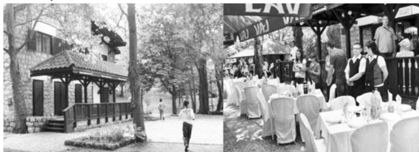
Мотел на Злотским пећинама: Затворен(лево)-отворен за министра(десно)

Дестинација је географски више-мање ограничен део простора који задовољава туристичке потребе и захтеве, уобичајених или специфично циљаних група туриста. Она представља битно место за примену планирања и стратегије управљања. Дестинације су у фокусу пажње свих интересних група у туризму јер управо оне у највећој мери подстичу и мотивишу туристичка путовања.