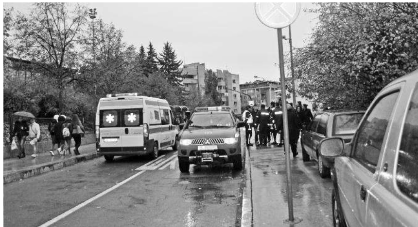
Увиђај са лица места

- Најпре је брзо прошао један аутомобил, а иза њега је ишао младић који је ударио у људе. Он је на кривини, изгубио контролу над возилом, прешао на супротну страну коловоза и ударио у пешаке на тротоару. Колима је прво ударио младића, а онда „по-