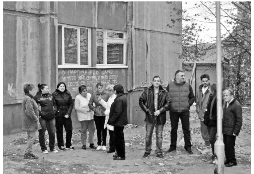
Станари зграде у улици Албанске споменице