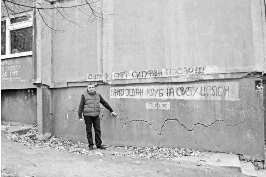
Јурица Љикић показује оштећења на згради

пројекту термоизолације зграде јер би то било трајно решење у наредних 30 година – рекао је Петровић. Д.К.