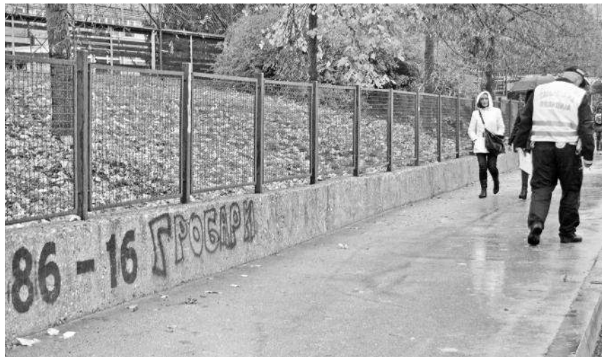
Тротоар где су ударени пешаци