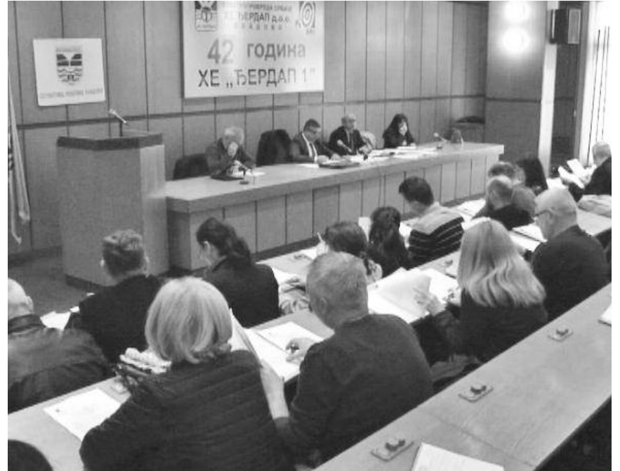
Програм мера за унапређење услова живота на територији општине