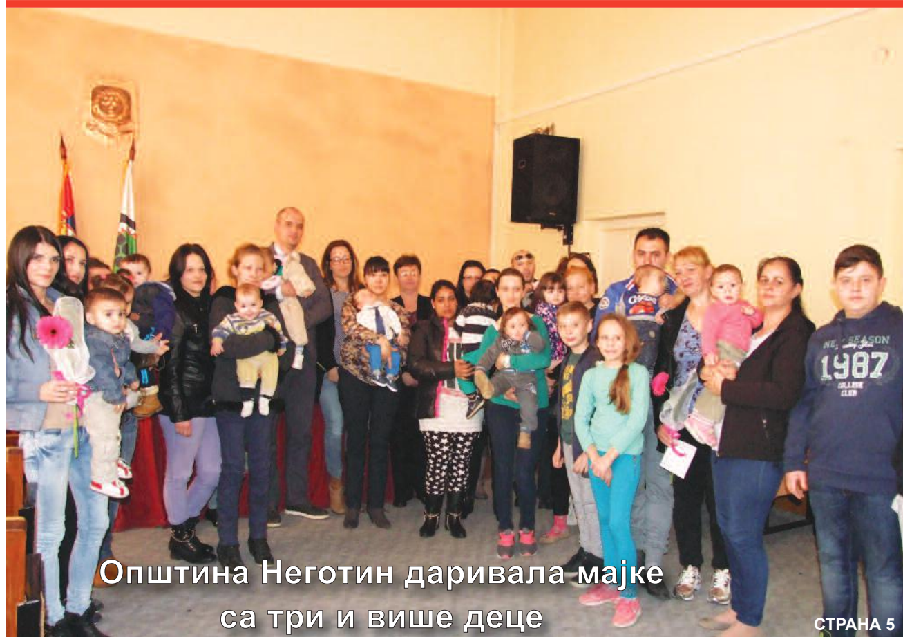
Општина Неготин даривала мајке са три и више деце