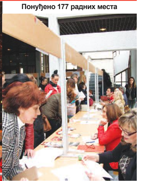
Понуђено 177 радних места