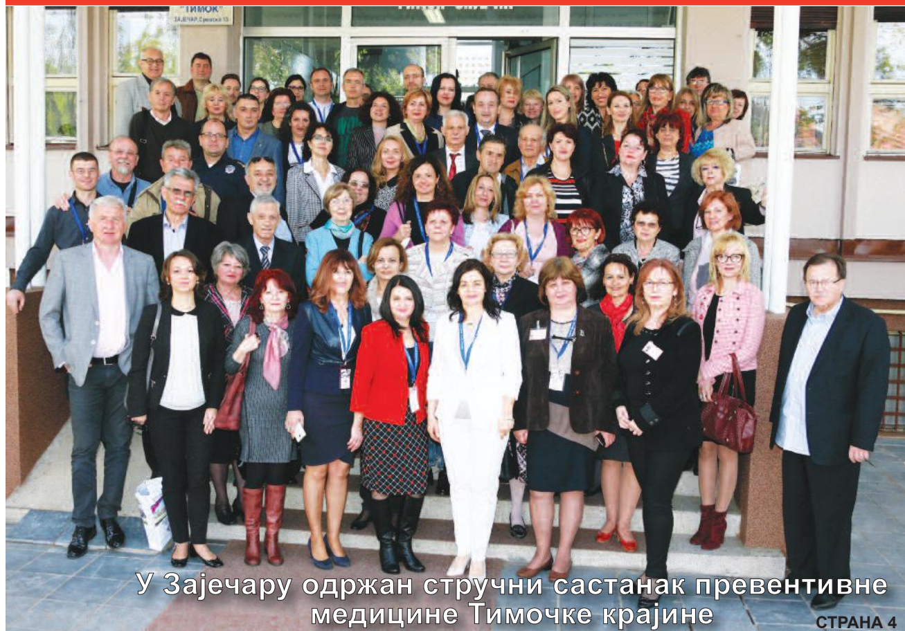
У Зајечару одржан стручни састанак превентивне медицине Тимочке крајине