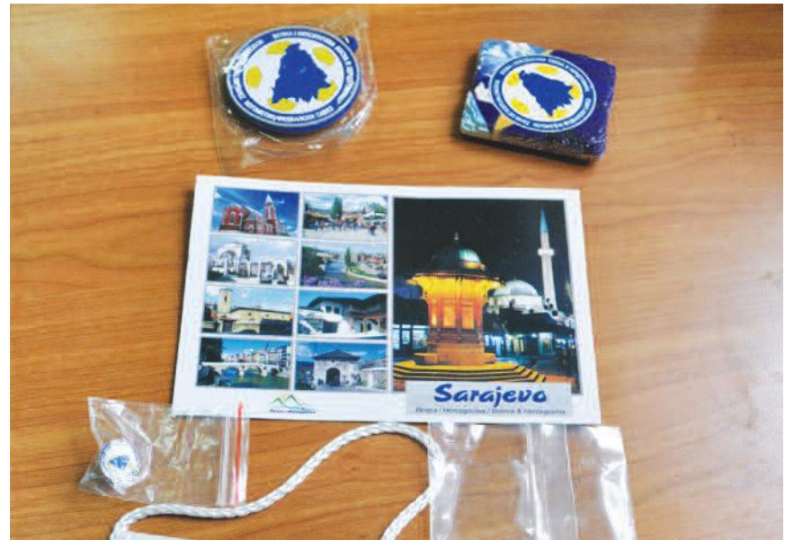
Отворена изложба фотографија у библиотеци