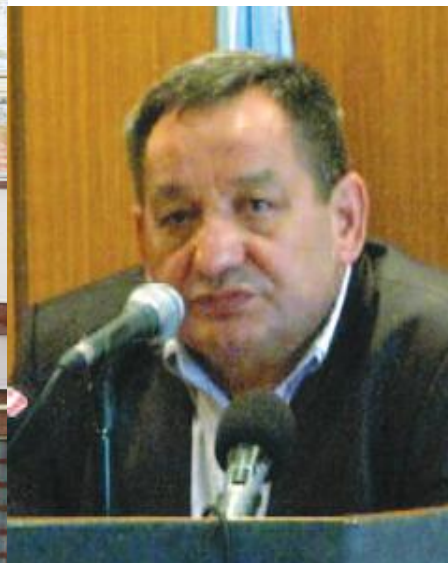
Одржана Свечана седница СО Кладово