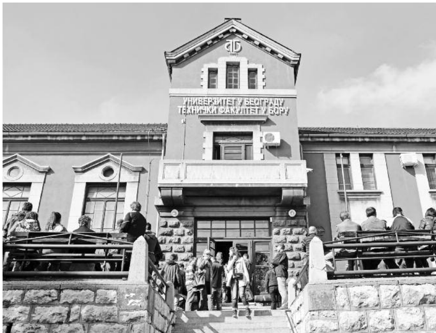
Технички факултет у Бору