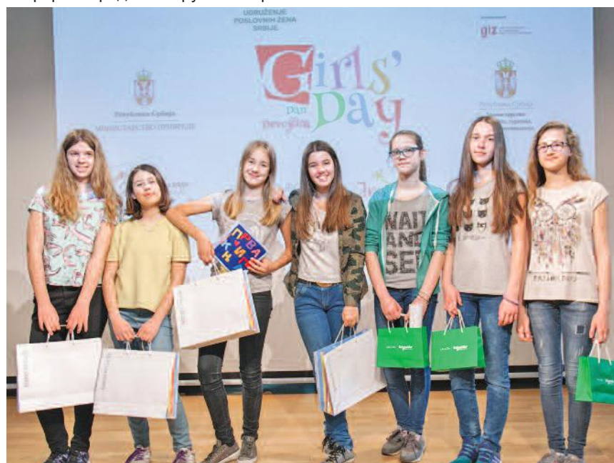
Победнице такмичења „Ухвати идеју”

Дан девојчица у ИКТ-у установљен је на нивоу Уједињених нација и обележава се сваког последњег четвртка у априлу. Од 2001. године, када је у Европи (Немачкој) први пут обележен, у овој манифестацији учествовало је више од милион девојчица. Удружење пословних жена Србије први пут је организовало Дан девојчица у ИКТ-у 28. априла 2011. године. У протеклих шест година колико УПЖ Србије обележава овај дан кроз пројекат је прошло више од 8000 девојчица, а резултати показују заинтересованост девојчица да кроз овакав вид реалних сусрета са предузетницама препознају предузетништво као могуће будуће место за запошљавање.