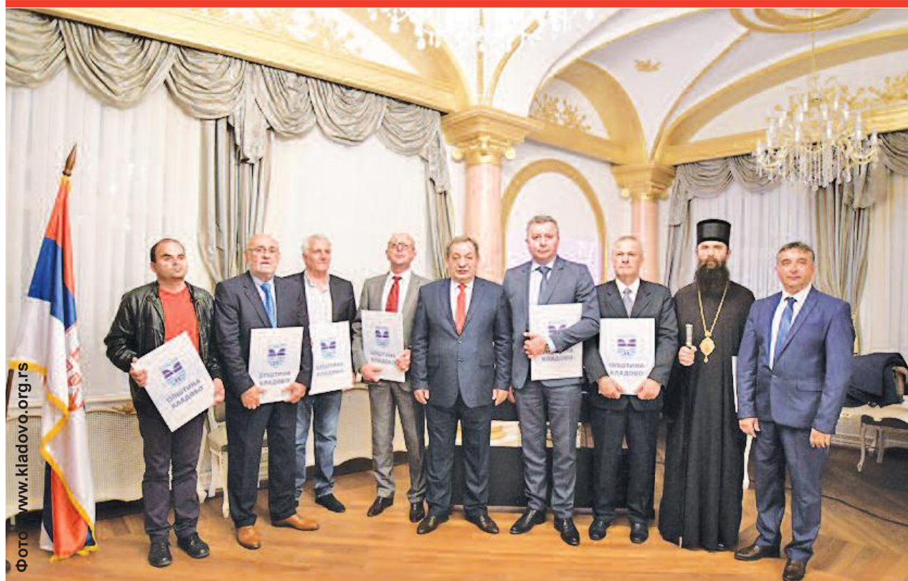
Додељене Повеље захвалности у Кладову