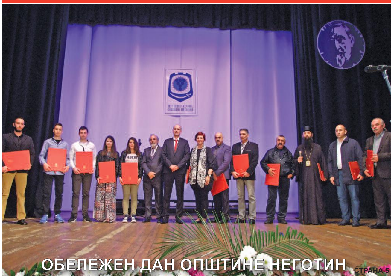
ОБЕЛЕЖЕН ДАН ОПШТИНЕ НЕГОТИН