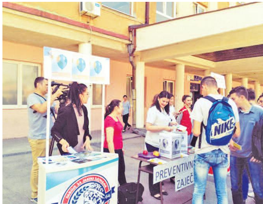
Неготинске школе уписују 370 ђака

У организацији ЗЈЗ "Тимок" Зајечар, Центра за промоцију здравља, Превентивног центра ЗЦ-а Зајечар и Црвеног крста Зајечар,