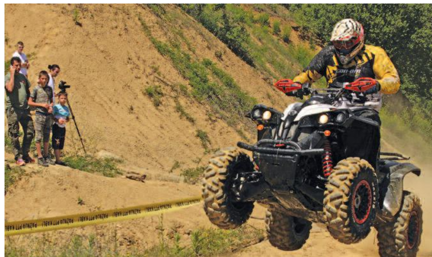
У оквиру пројекта "Омладински фото активизам"

Пројекат "Подршка пољопривреди, туризму и малој привреди : креативност и иновативност у пракси" - "Овај медијски садржај суфинансиран је од стране општине Књажевац. Ставови изнети у подржаном медијском пројекту нужно не изражавају ставове органа који је доделио средства."