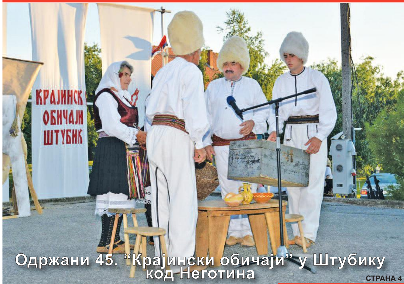
Одржани 45. "Крајински обичаји" у Штубику код Неготина