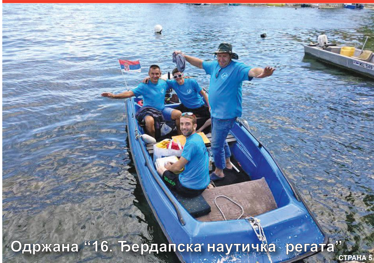
Одржана "16. Ђердапска наутичка регата"