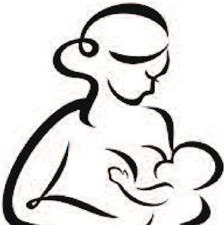
Све сигурнија реализација пројекта

Користи дојења исказане кроз четири тематске области: