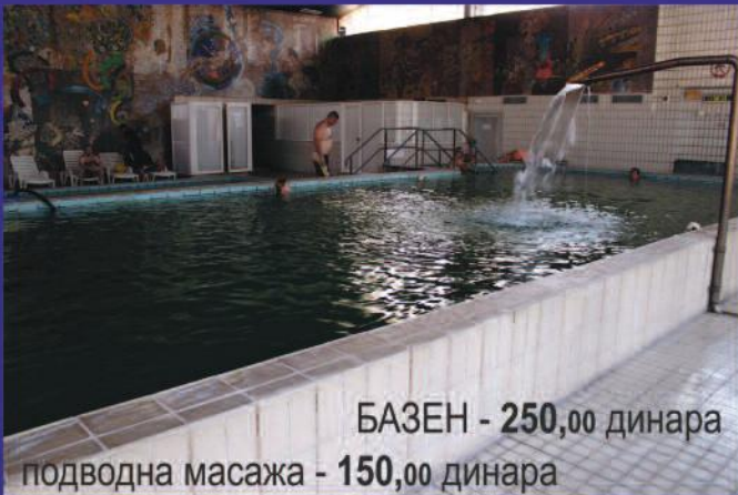
БАЗЕН - 250,00 динара

Пројекат "Три стуба развоја Кладова: туризам, мала привреда и пољопривреда" суфинансира Општина Кладово – „Ставови изнети у подржаном медијском пројекту нужно не изражавају ставове органа који је доделио средства“.