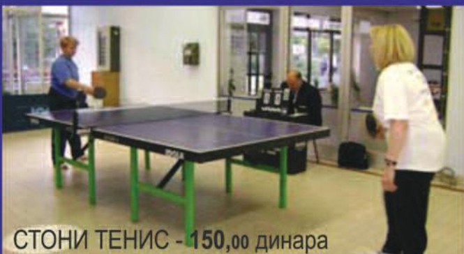
СТОНИ ТЕНИС - 150,00 динара