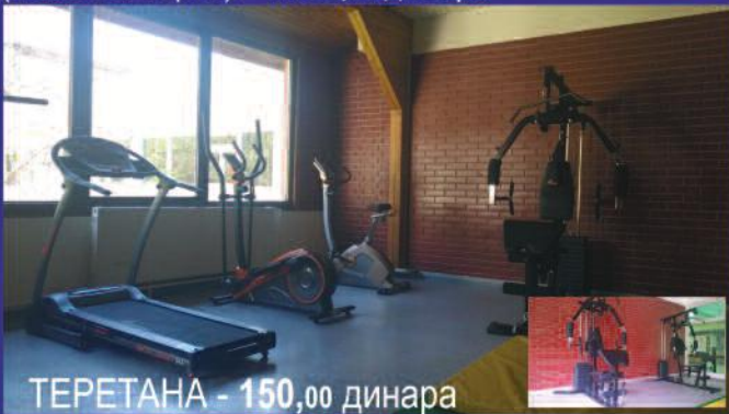
ТЕРЕТАНА - 150,00 динара