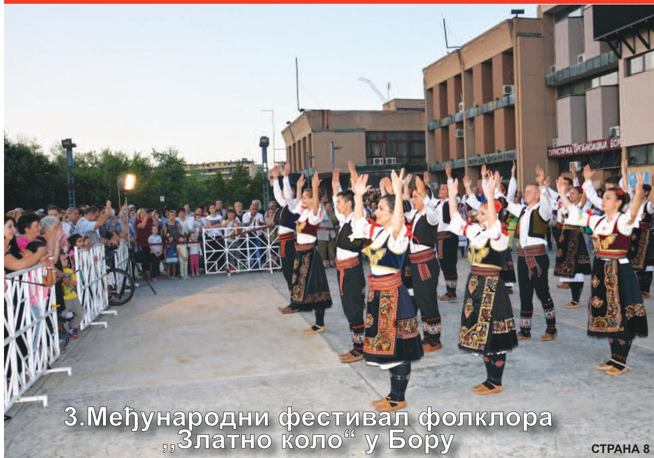
3. Међународни фестивал фолклора „Златно коло“ у Бору