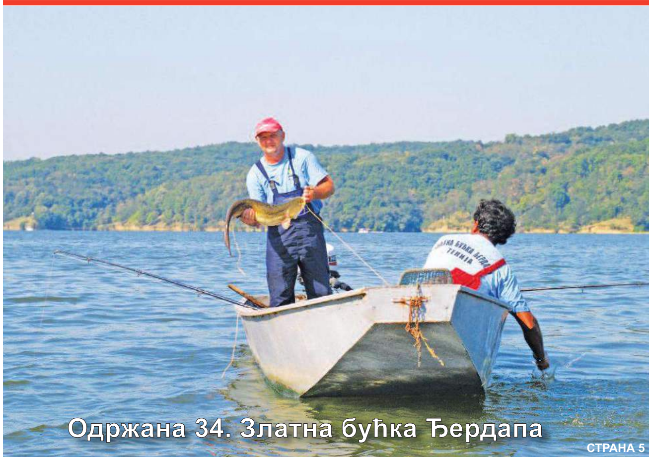
Одржана 34. Златна бућка Ђердапа