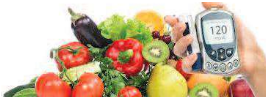
Златна труба за Књажевац

Основу исхране чине намирнице биљног порекла, нарочито интегралне житарице, махунарке, поврће. Ако једете месо треба бирати посне врсте меса: пилетину, ћуретину, телетину. Месо барити или барити са мало уља. Са меса