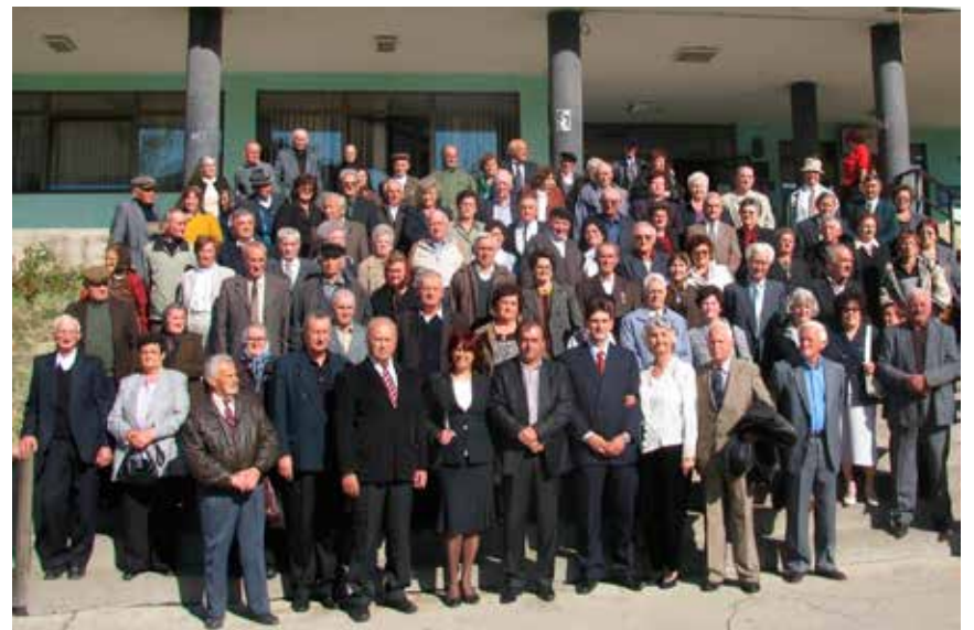
Манифестација „Златна свадба“

У оквиру пројекта "Чувари традиције, културе, здравља и среће"