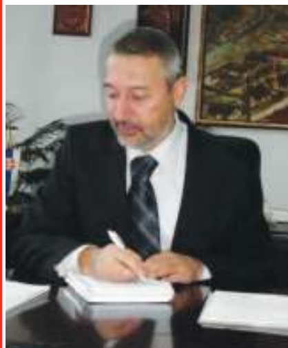
Дејан Вагнер, председник Општине Мајданпек