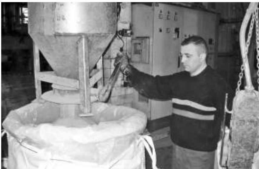
Паковање бакарног праха у џамбо вреће

Преко хиљаду тона праха испоручено већинском власнику Пометону С.п.А. из Италије који га даље продаје по целом свету. Честе посете задовољних купаца из Аустрије, Америке, Јужне Кореје, Француске, Немачке и других земаља.