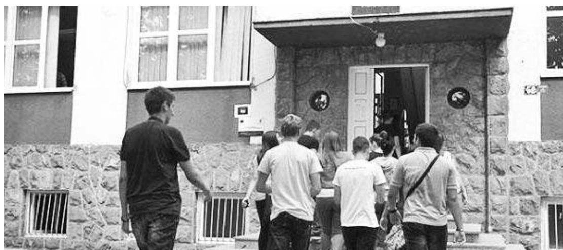
Техничка школа у Књажевцу

КЊАЖЕВАЦ - Техничка школа у Књажевцу је од стране екстерне комисије Школске управе добила највећу оцену за свој рад. По јединственим критеријумима, све образовне установе се оцењују од 1 до 4. У Техничкој школи са поносом истичу да су за свој труд и рад са ученицима из свих области добили оцену 4.