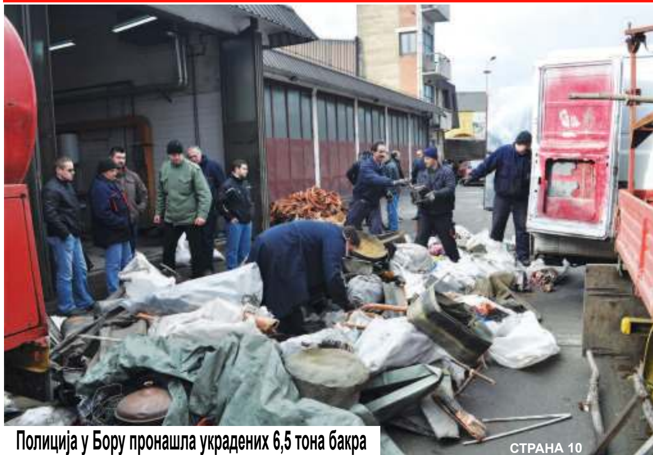
Полиција у Бору пронашла украдених 6,5 тона бакра