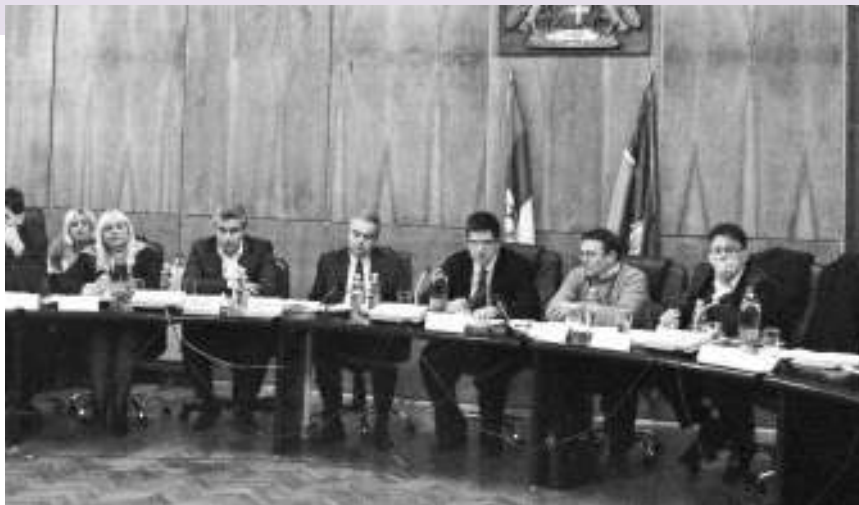
Једна од седница СО Бор

- Управо је то била основна идеја, да се људи информишу на који начин да остваре