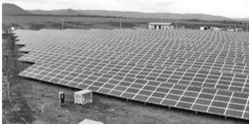
Соларни парк код Кладова