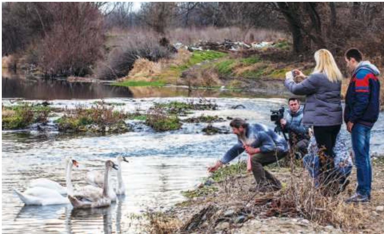
Лабудови привукли пажњу мештана

КЊАЖЕВАЦ - У атару књажевачког села Штипина, на Белом Тимоку, од недавно станује породица лепих, белых лабудова. Мужјак и женка са троје младунаца, још малих за бело перје, за