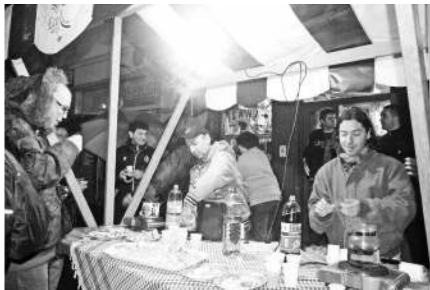
Кувано вино, ракија и мезе

Ова најдужа и најстарија улица у граду, чији кућни бројеви премашују 250, поново је живела некадашњи живот и