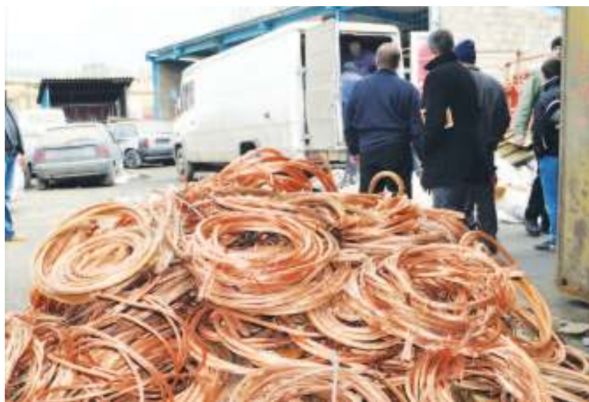
Део заплетењеног бакра

- Све ово је месецима, како се сумња, крадено из погона РТБ – речено нам је у полицији. – Ј. Б. се терети да је нелегално откупљивао тај метал, који је је, када је скупио довољну количину да напуни