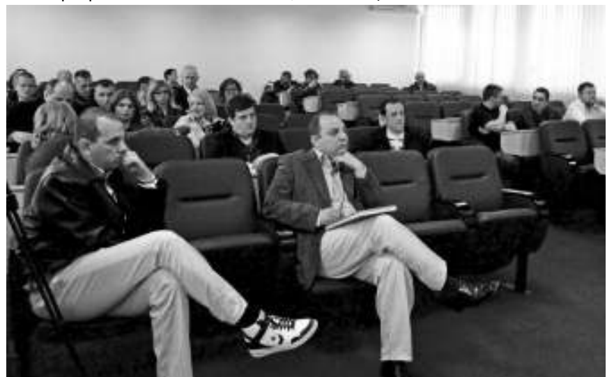
Са једне од седница СО Мајданпек