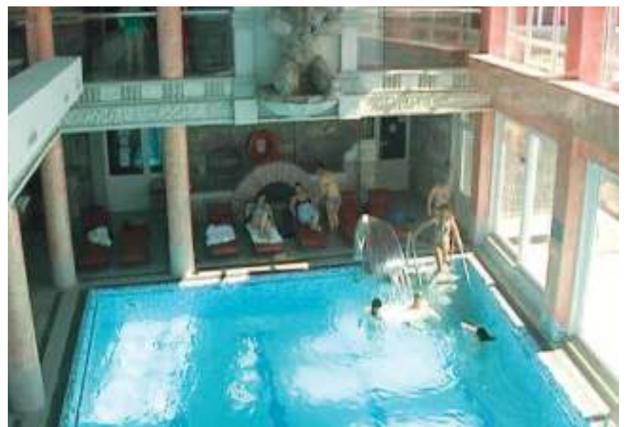
Басен у спа-центру