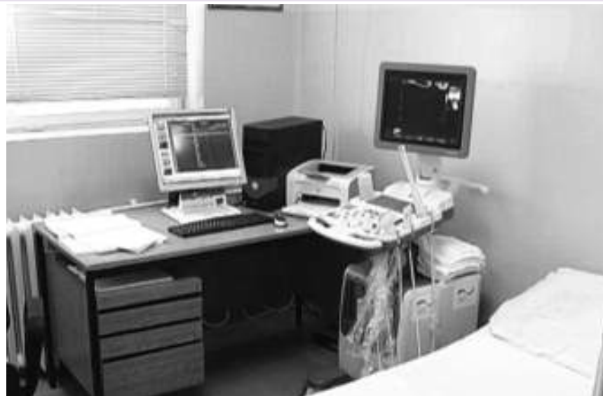
Ултразвучни апарат са сондом за биопсију простате

- Реч је о веома значајној донацији амбасаде Немачке и локалне самоуправе, са којом је побољшан ниво дијагностике, с обзиром да по-