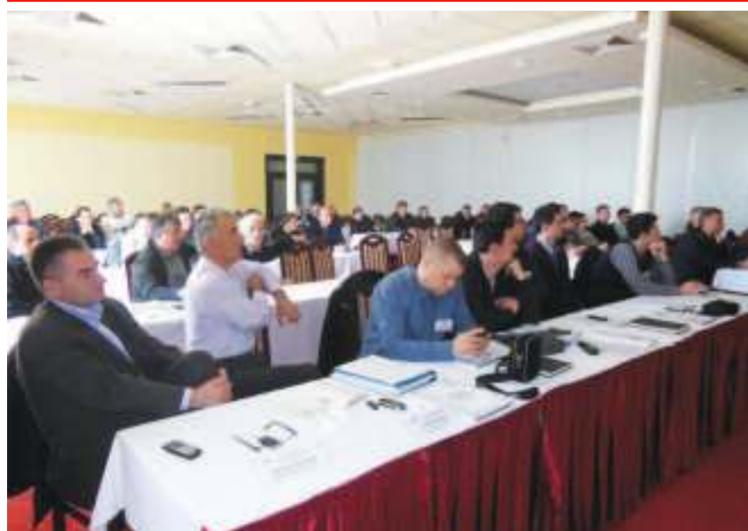
Повереници Цивилне заштите

КЛАДОВО -Улога и задаци повереника и њихових заменика у систему Цивилне заштите и руковођење у ванредним ситуацијама на подручју локалне самоуправе, само су неке од тема које су на стручном скупу презентовали предавачи из Сектора за ванредне ситуације. Обука је организована за чланове проширеног састава Општинског штаба за ванредне ситуације општине Кладово. Значајна је због ефикаснијег деловања јединица цивилне заштите и појединача током елементарних непогода и других ванредних ситуација.