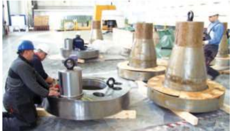
Ревитализација агрегата у ХЕ "Ђердап 1"

предах. Они су навикли на динамику сложених операција и не дозвољавају да дође до непланираних застоја. Да је тако, уверили смо се у машинској хали хидроцентралне код Кладова где