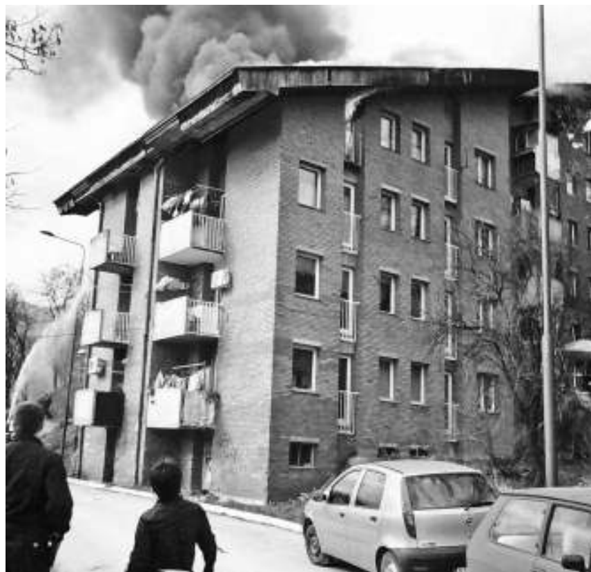
Пожар је једва угашен