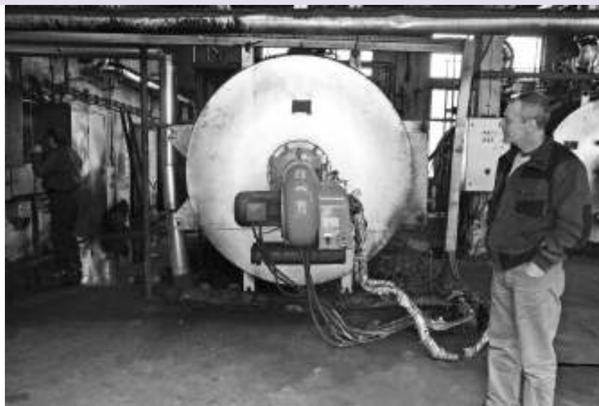
ЈКП „Бадњево“, „Топлана Борска“

Како би додатно унапредили техничке капацитете у неготинским топланама и обезбедили ефикасније коришћење и наплату енергије, „Бадњево“ је код Немачке развојне банке КФВ аплицирало за пројекат по-