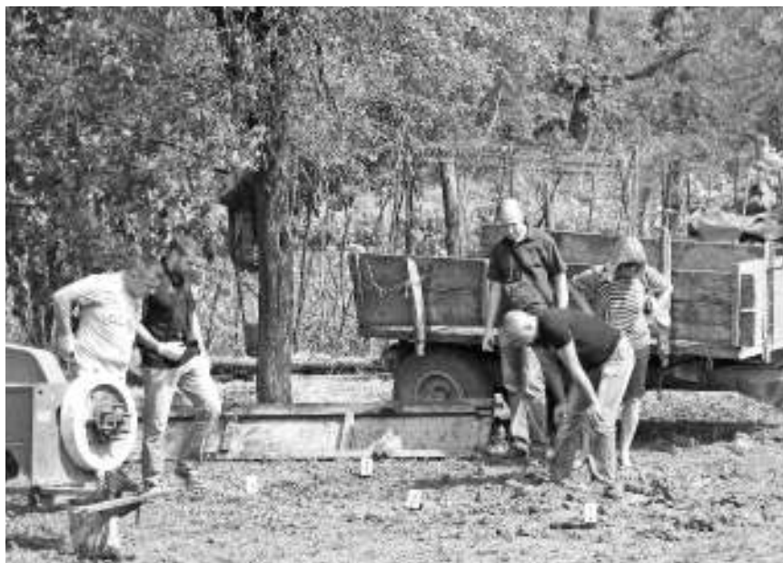
Увиђај на лицу места

Обдукција показала да смрт бебе није била насилна