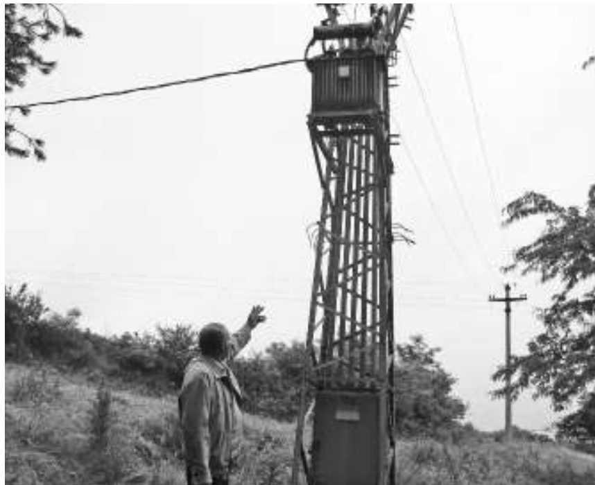
Стубна трафо станица на коју се попео Н.В.

Увиђајем на лицу места установљено је да је малишан преживео правим чудом. Јер, да се попео неколико центиметара