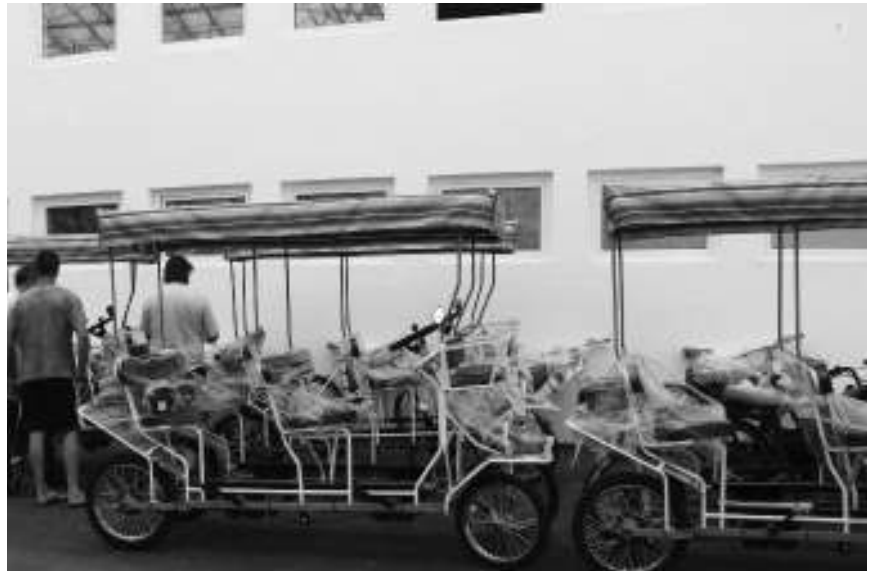
Електроцикли за превоз туриста

МАЈДАНПЕК - У оквиру реализације пројекта “Археолошко наслеђе и налазишта ближа туристима”, који општина Мајданпек спроводи у партнерству са општином Димово из Бугарске, а финансира Европска унија кроз програм прекограничне сарадње Бугарска – Србија, са циљем да унапреди инфраструктурне капацитете Центра за посетиоце – Музеј Лепенски вир, обезбеђен је део пратеће опреме. Овај пројекат ускоро ће омогућити набавку и уградњу опреме за грејање и хлађење Центра за посетиоце, али је већ набављена и опрема за еколошки превоз посетилаца од паркинга до музеја.