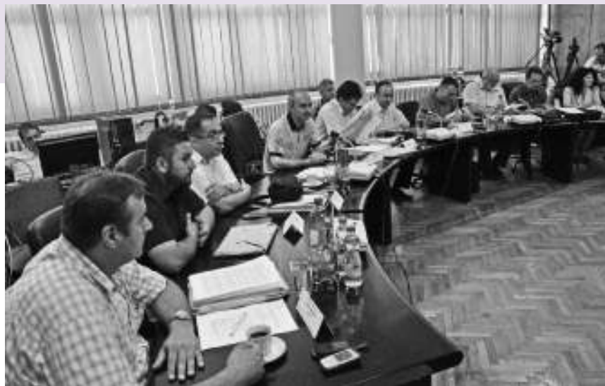
Седница СО Бор

У наставку седнице усвојени су извештаји о ради Општинске управе и јавног правобранилаштва, а највећа дискусија водила се о извештајима о раду јавних и јавно комуналних предузећа и установа у 2013. години.