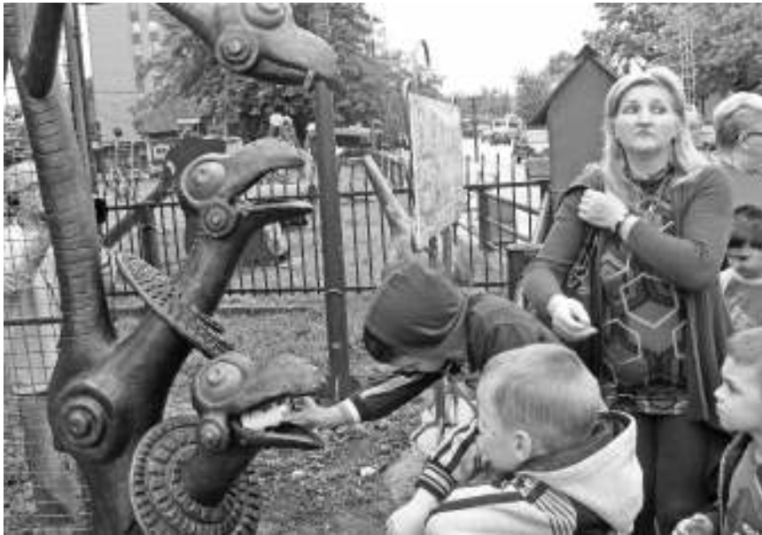
Малишани су били одушевљени

Пројекат “Археолошко наслеђе и налазишта ближа туристима”