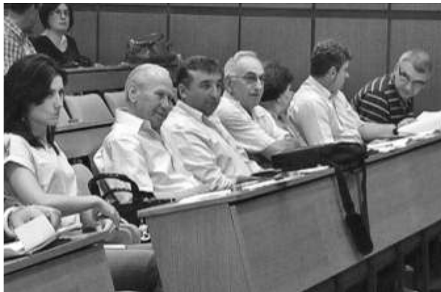
Одборничка група СНС у СО Кладово

Тања општинска каса није се негативно одразила на функционисање буџетских корисника. Одборничка већина позитивно се изјаснила и о трећем овогодишњем ребалансу буџета. Приходна страна увећана је за 41,2 милиона буџетских и донаторских сред-